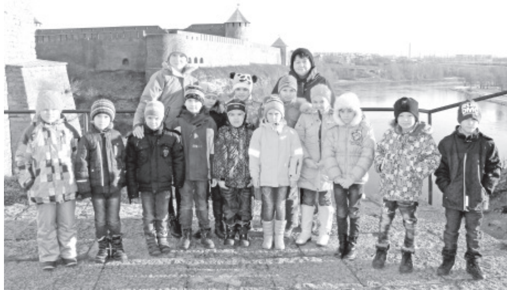
На экскурсии в Нарвском музее.

После концерта, и ученики, и родители, а также все другие гости, получили возможность посмотреть классные помещения и пройти по всему зданию. Конечно же, ученикам это было безумно