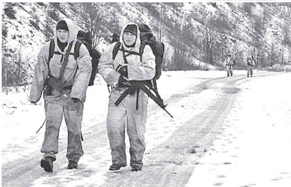
Десант Утриа проводился при разных погодных условиях.