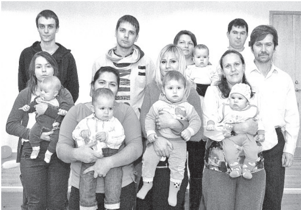
Маленькие граждане волости вместе с родителями на приеме у волостного старейшины.

В среду 10 декабря девять новых граждан волости вместе с родителями были приглашены на прием к волостному старейшине и председателю волостного собрания. Прием состоялся в нашем новом образовательном комплексе.