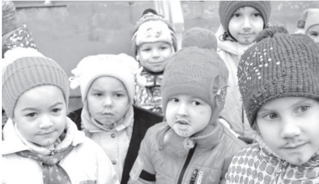
Мартынов день в Ольгина.

Каждый ребенок ждет Деда Мороза, но ждать до бесконечности ребенок не может. Рождественский праздник в детских группах в Синимяэ состоится 22 декабря в 16.00. В Ольгина рождественский праздник будет 23