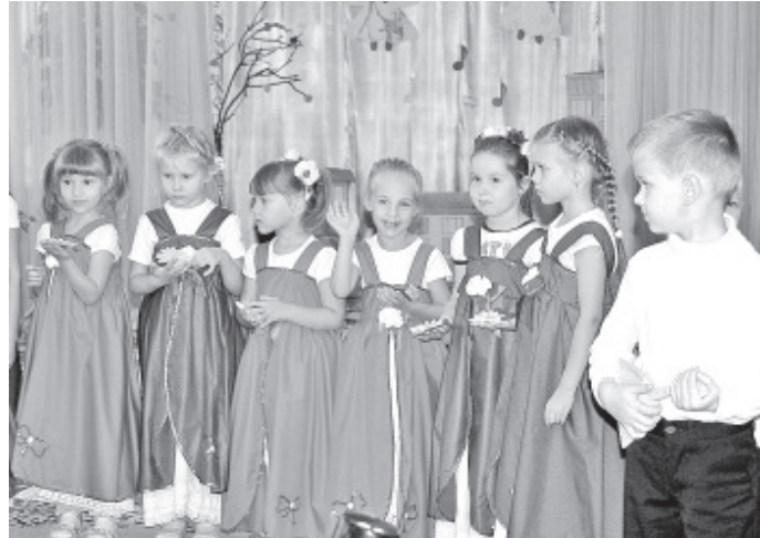
На музыкальном фестивале «Сердечко».

Как замечательно видеть эту детскую радость от любой, казалось бы, незначительной мелочи. В детском саду дети ждут гномиков и старательно готовятся к праздникам: учат стихи и разучивают танцы и песни. Мастерам, пекут рождественское печенье – руки – ноги – все в работе. Чтобы