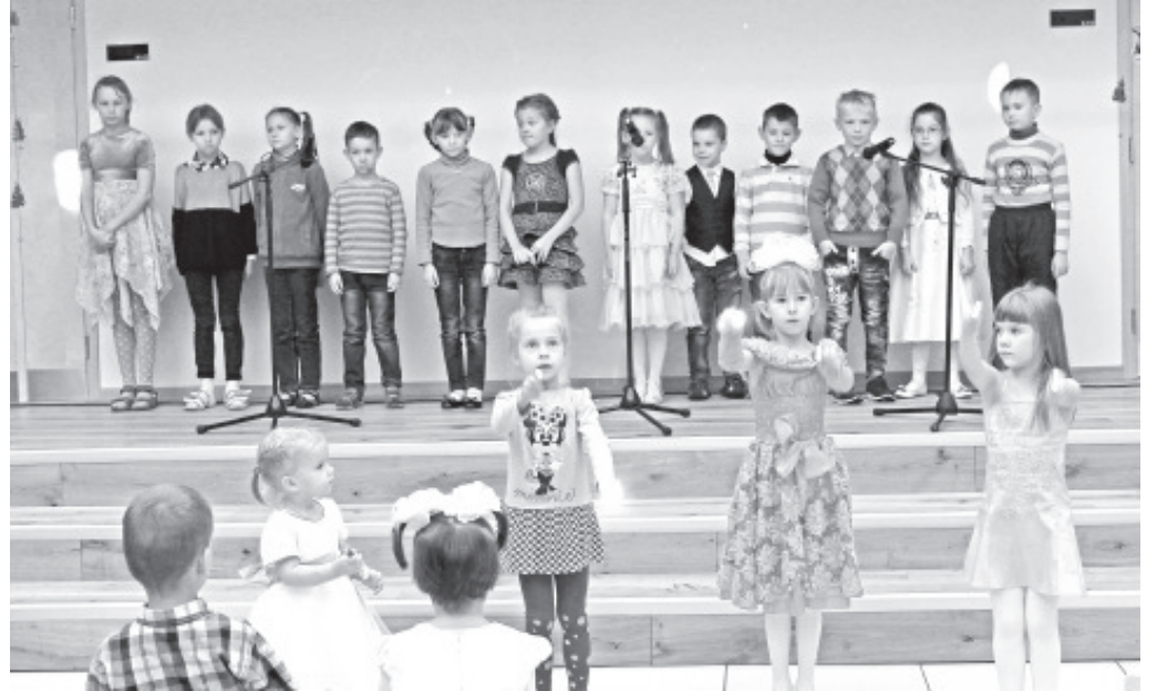
.....так и маленькие.

30 ноября в Синимяэ в здании новой Синимяэской школы собрались около двухсот человек, чтобы отметить начало адвента.