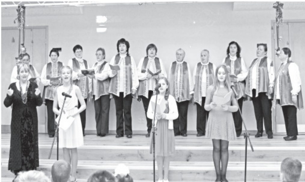
На праздничном концерте выступали как большие .....

Волостное собрание, волостное управление