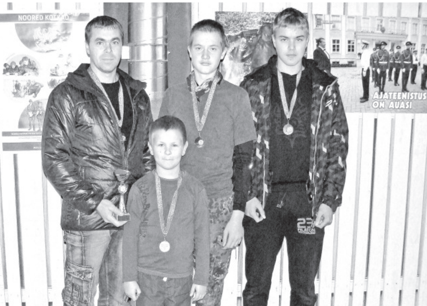
Бронзовая команда Синимяэ.