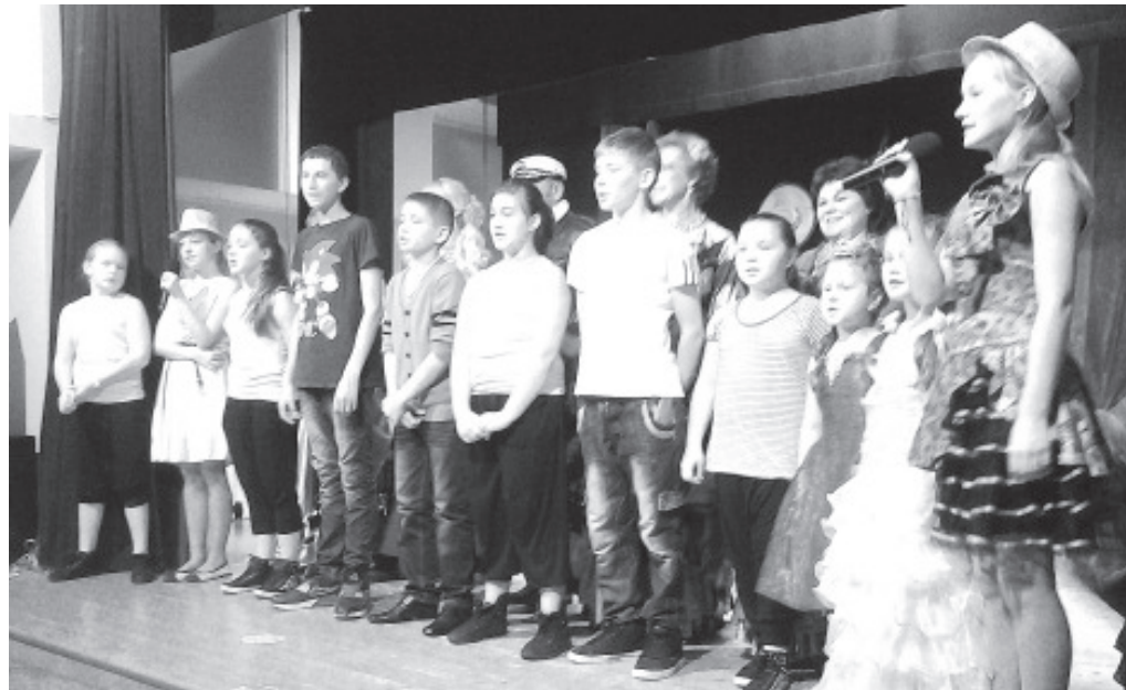
Дети выступают для пап.

Бурными аплодисментами наградили зрители выступавших со своей программой