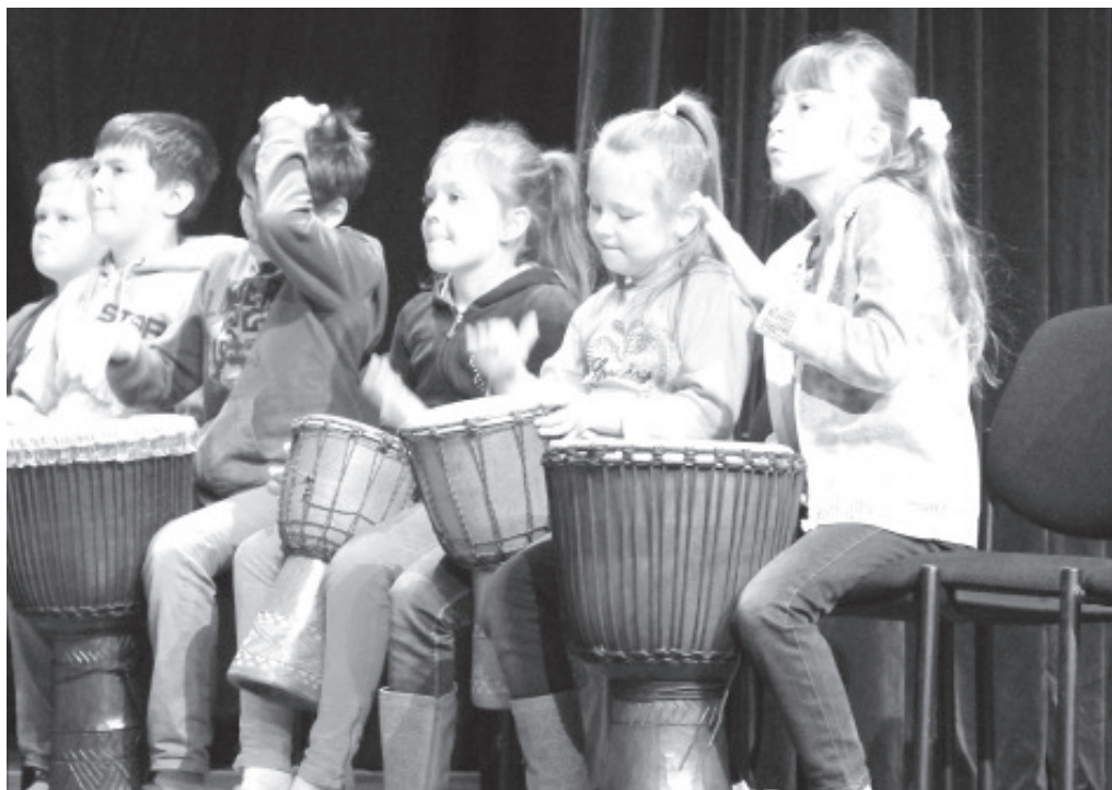
Делаем сами музыку.