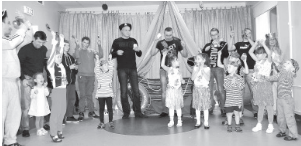
День отцов в детском саду в Ольгина.