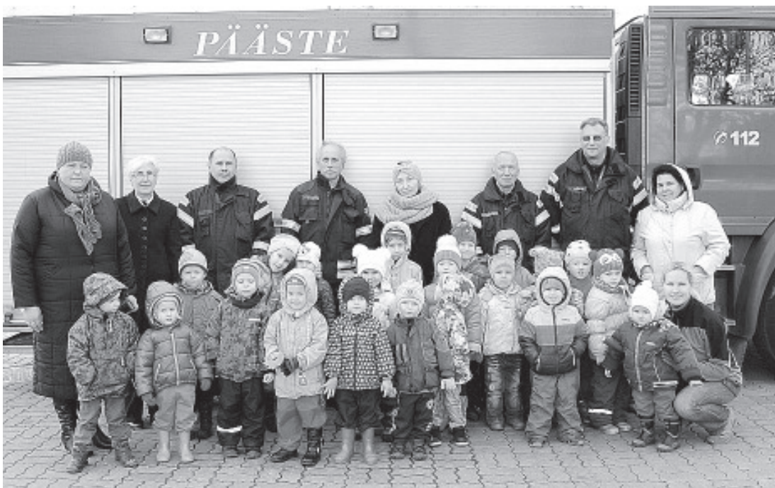
Спасательный департамент в гостях у детей детского сада в Ольгина.

садике состоялся осенний праздник. Погода в этом году была к нам благосклонной и оба праздника, как в Синимяэ, так и Ольгина были расцвечены разными красками и наполнены приключениями. А в Синимяэ особенно, где праздник прошел под девизом ориентирования. Маленьким ориентировщикам нужно было найти все цвета осени на проложенной на Паргимяги трассе ориентирования. На каждом контрольном пункте детишек ожидали цветные сюрпризы: красный помидор, желтая брюква, зеленый огурец, а ...для