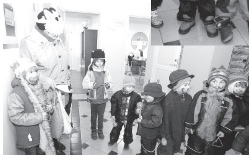
Ряженные в волостном доме.

Вышедшие полюбопытствовать на пеструю компанию гостей волостные чиновники довольно быстро вспомнили, что настал Мартов день и, что они имеют дело с ряжеными довольно разных размеров. Хотя внезапные гости и убеждали, что пришли издалека и что у них теперь мерзнут ноготки и болят пальчики на ногах, глазом поострее