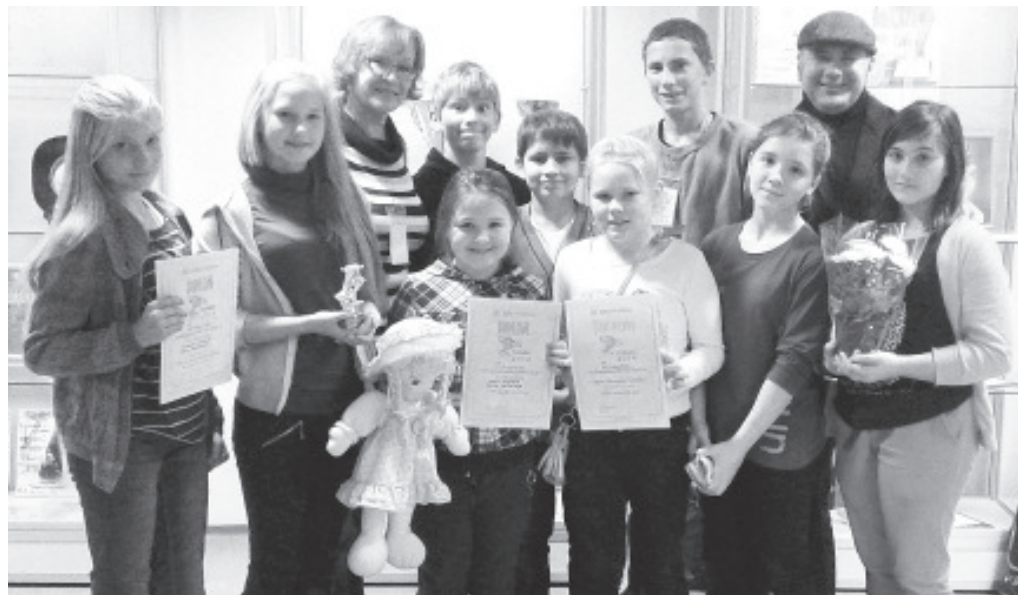
Вайварские дети на театральном фестивале.

В этом году мы вновь приняли приглашение участвовать в «Ералашке», где, конечно же, показали новую миниатюру