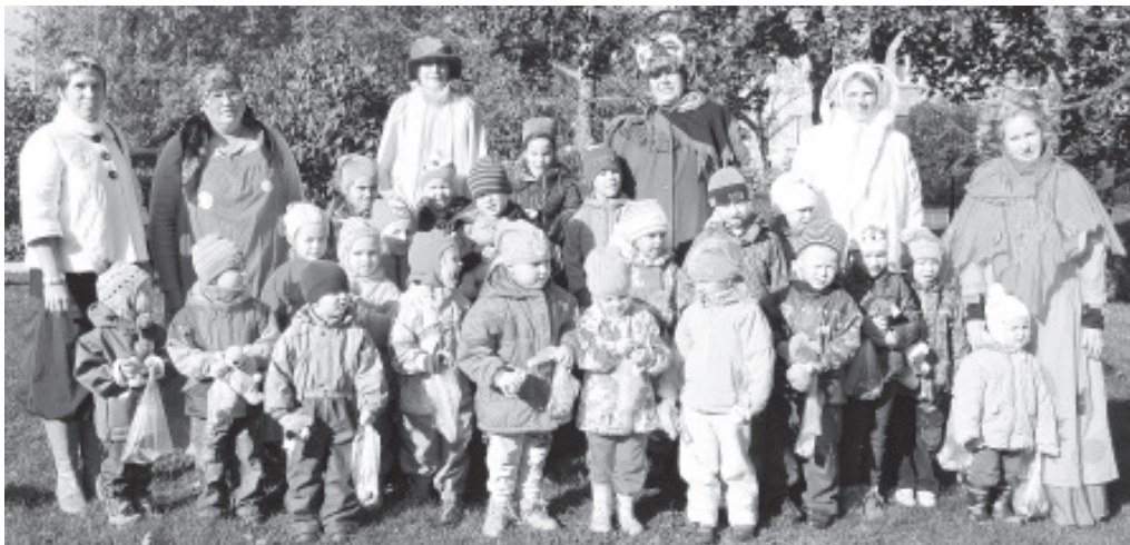
Праздник осени в детском саду в Ольгина. Фото: Зх Вайварский детский сад

http://album.vaivaravald.ee > Vaivara Lasteaed