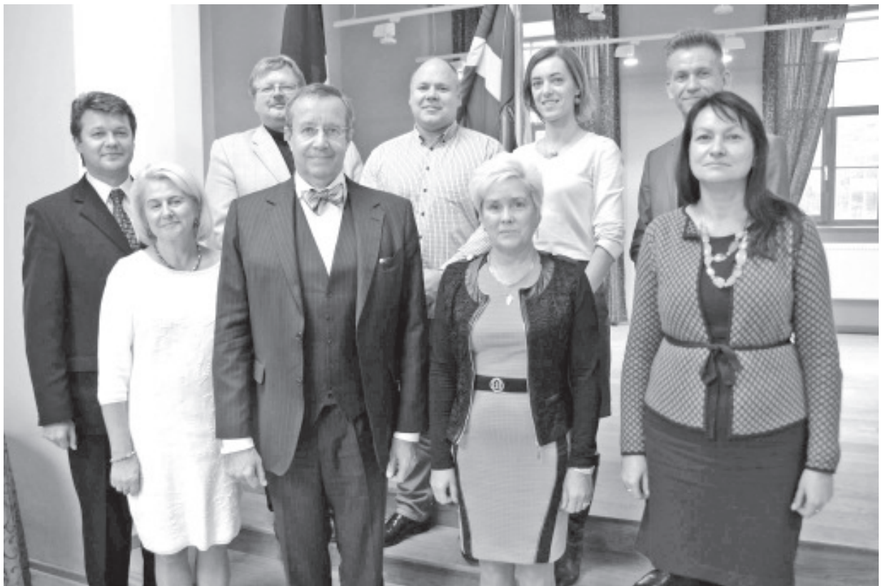
Fotomeenus kohtumiselt.

„Kodakondsus pole sund, see on vaba tahte avaldus. Äratundmine, et nii on parem, et nii on õige. See on arusaam, mida olen ühes tänavuses intervjuus kirjeldanud iga