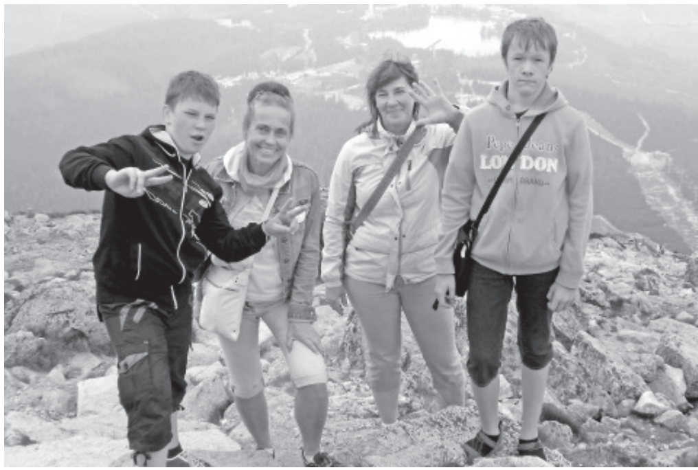
Tutvumas Slovakkia mägedega.

Õhtupoolikul käisime paadisõidul mööda Vah'i jõge. Vah'i jõgi asub Poola ning Slovakkia piiril. Sõit oli vapustav, lisaks