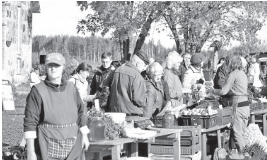
Kauplemine on täies hoos.

Vastavalt juba juurdunud tavale toimub Vanatare juures laet kaks korda aastas – kevadel ja sügisel. Sügislaada ajaks on kujunenud oktoobri esimene laupäev. Põhilised koristustööd on tehtud, on millega kaubelda. Lisaks sellele on laet väikeseks võimaluseks aeg maha võtta selles pidevas rabelemises, mida maainimesed eluks nimetavad. Tulla kokku, rääkida juttu, osta midagi, müüa midagi ja lihtsalt nautida laadamelu, nagu see ikka Eestimaal tavaks on olnud. Omad korrektiivid teeb muidugi ka ilm, aga üldiselt tundub, et Vanatare rahvas on Vanajumalaga sõbrasuhteis – lausvihma pole kunagi sadanud. Jahedat ilma ja tuult pole maainimene aga kunagi kartnud - Eestimaa