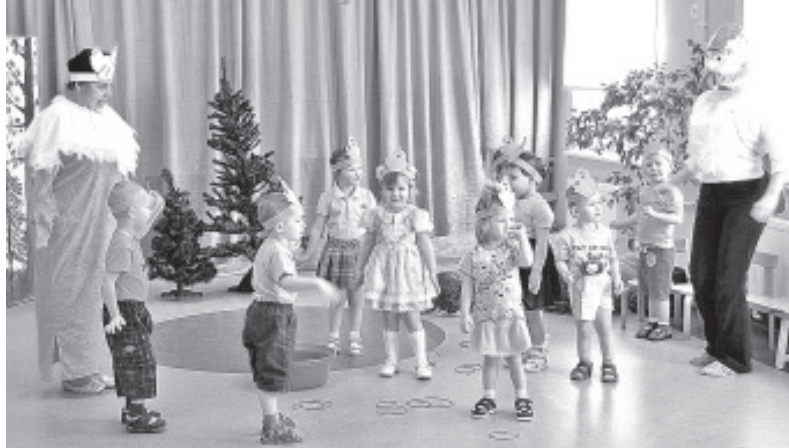
Näitlejate puuduse üle kurta ei saanud.

„Kevad saabub, kevad saabub, päike paistab soojemalt“ – laulsid 11. aprillil rõõmuga meie lapsed ehitusplatsil Sinimäe kooli ja lasteaiahoone nurgakivi panemise