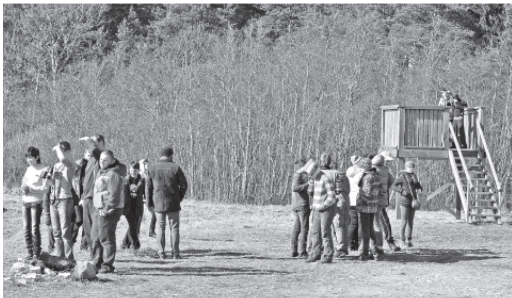
Linnuvaatlustorni juures.

Teisel päeval külastasime erinevaid vaatluskohti: Põgari-Sassi rannaniitu, Puise nina, Kiidevat ja Haeskat. Nendes kohtades nägime lahesoppides suuri parvesid laululuiki ( Cygnus cygnus ) ja kümnokk-luiki ( Cygnus olor ). Selle päeva parim leid oli naaskelnokad