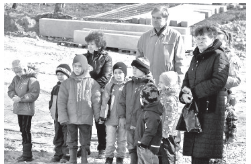
Pisipere pärast esinemist.