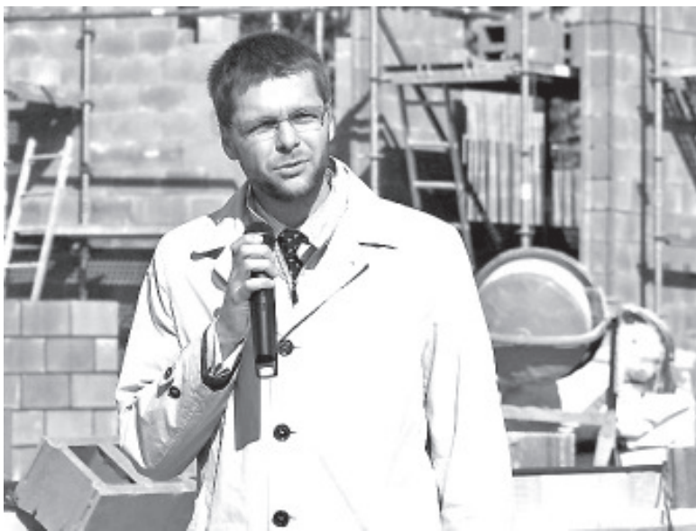
Haridus- ja teadusminister Jevgeni Ossinovski.

Sinimäe Põhikooli õpikeskkonna parandamisele on jätkuvalt võimalik kaasa aidata, tehes annetusi eriarvele EE282200221023385374, saajaks Vaivara