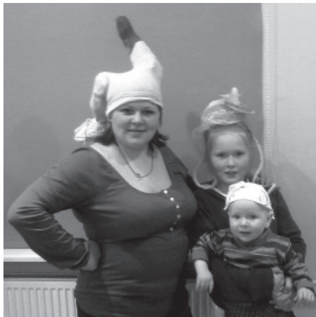
„Narride ball“.