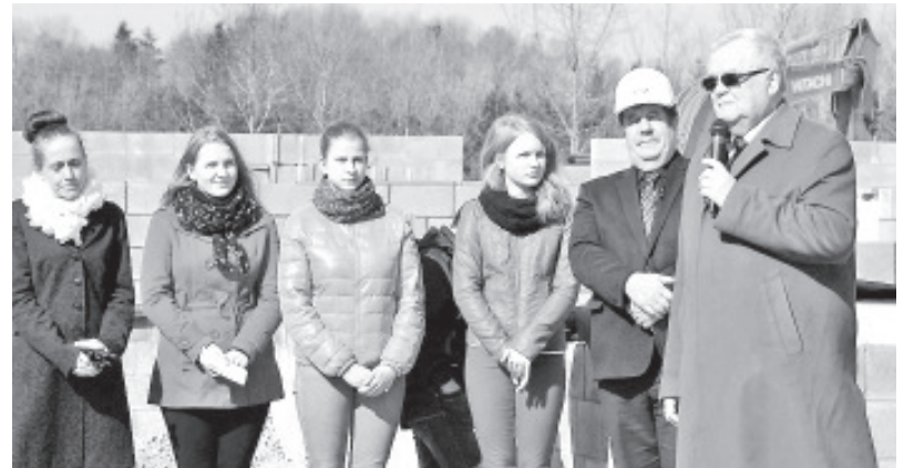
Слово имеет мэр города Таллинна Эдгар Сависаар.