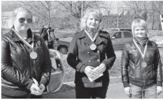
Награждение в классе женщин.....

столько в большой и более тяжелой машине, а в зимней резине при летних условиях, сделавшей машину менее управляемой.