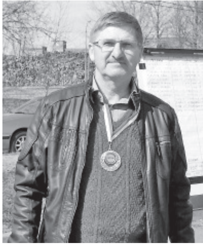
и победители в классе ветеранов.