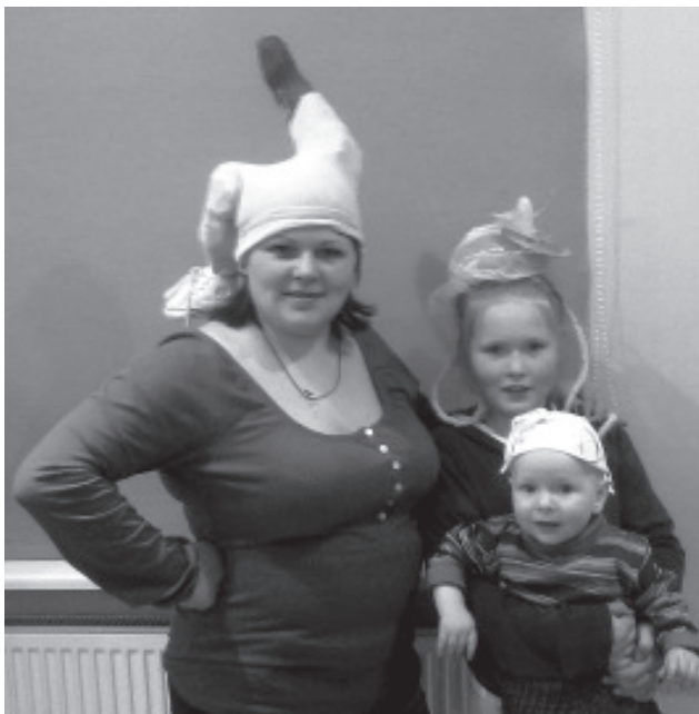
«Шляпный Бал Дураков».

Ещё одно мероприятие - тренинг «Я в команде», был проведён молодёжным центром «VitaTeam».