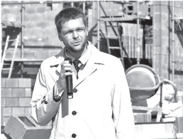
Министр образования и науки Евгений Осиновский.

В замурованный в краеугольный камень футляр положили, кроме уездной и волостной газеты еще списки детей и работников школы и детского сада, а еще ученики положили кусочек ржаного хлеба вместе со ссылкой на то, что в Вайвара когда-то была сельскохозяйственная школа. Звонкие голоса детсадовских малышей школьникам и их сияющие глаза были знаком будущей радостной жизни под одной крышей.