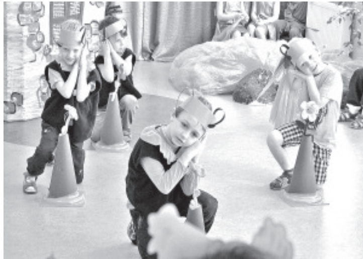
В артистах недостатка не было.

Большое спасибо учителям и помощникам учителей за подготовку коротеньких пьесок! «Весна идет, весна идет, теплее светит солнце» - радостно пели наши дети 11 апреля на строительной площадке, где проходила торжественная церемония закладки краеугольного камня на строительстве комплекса Синимяэской школы и детского сада, перед министром образования и науки Евгением Осинским, мэром города Таллинна Эдгаром Сависааром и многими другими известными людьми. В цилиндр, который будет замурован в стене,