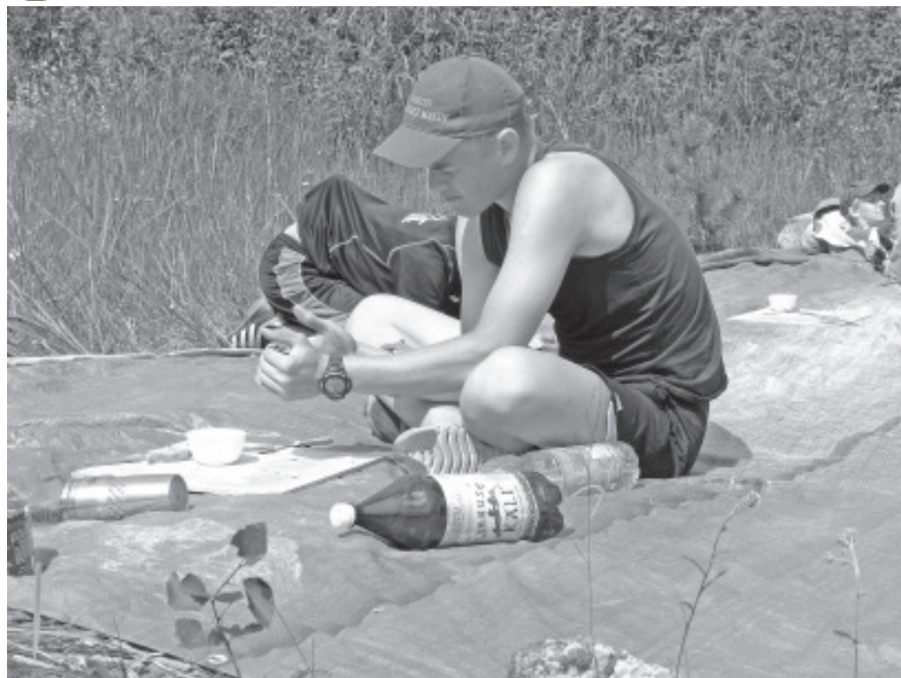
На мастер классе по лепке из глины.