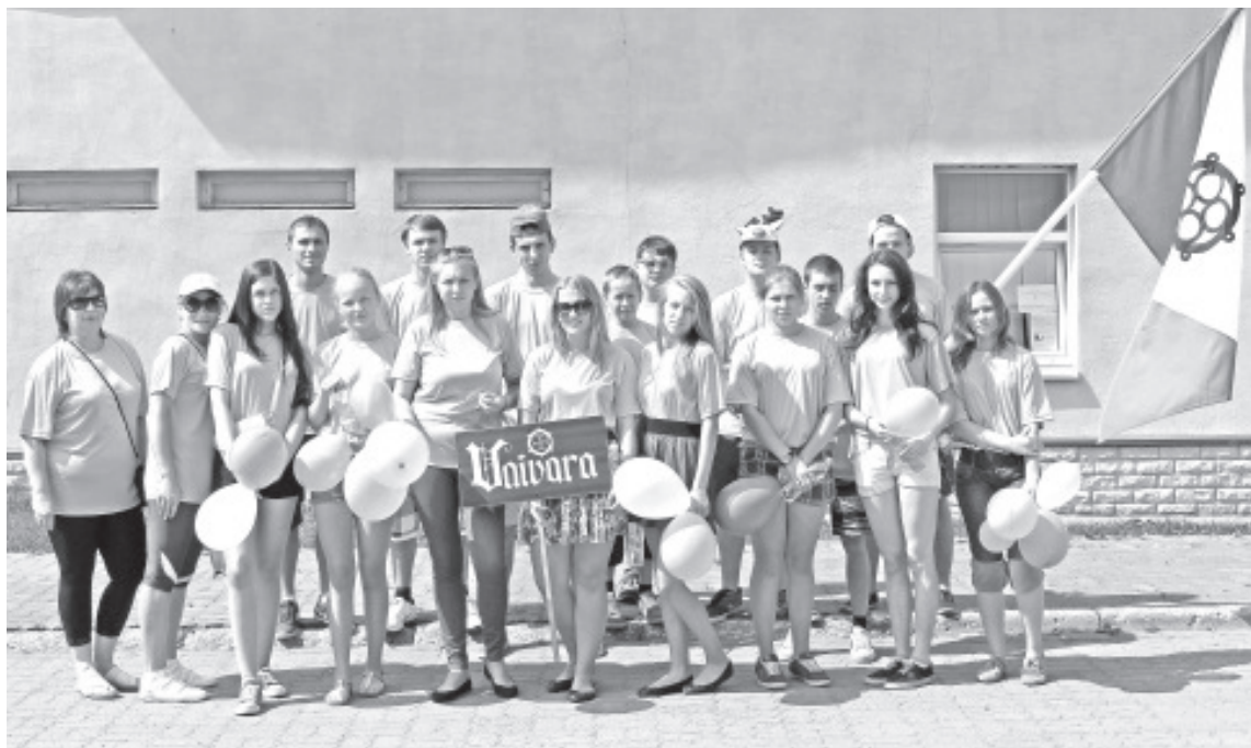
Это мы - Вайварский отряд школьной дружины «Алутагузе 2014».