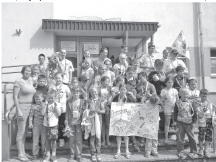
Летние Детские Дни в Ольгина.

Ну, а у себя в клубе мы принимали гостей из Силламяэ, они проводили для ребят мастер класс по лепке из глины и устроили показ восточных костюмов.