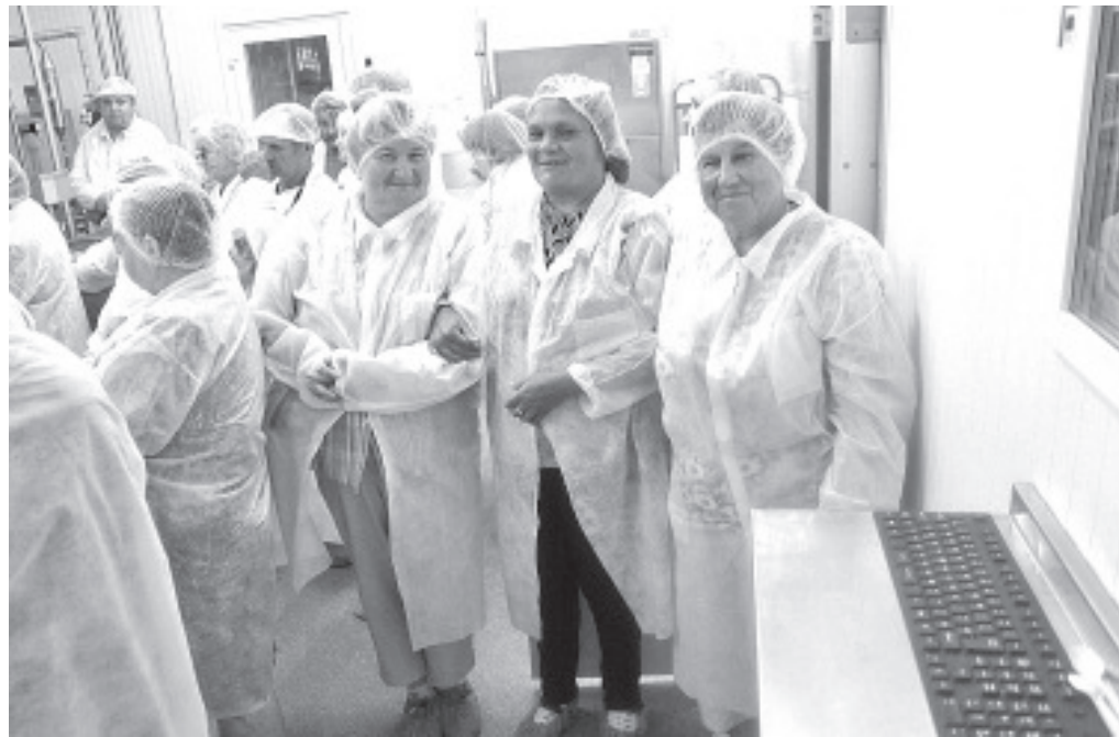
На маслобойне в Нопри.

Согласно программе поездки в первую очередь посетили Куремяэский монастырь, где для многих открылась очередная возможность смыть с себя летние грехи и проветрить легкие прохладным благодатным монастырским воздухом. После бодрящей остановки в Куремяэ был взят курс к замку Алатскиви, который в