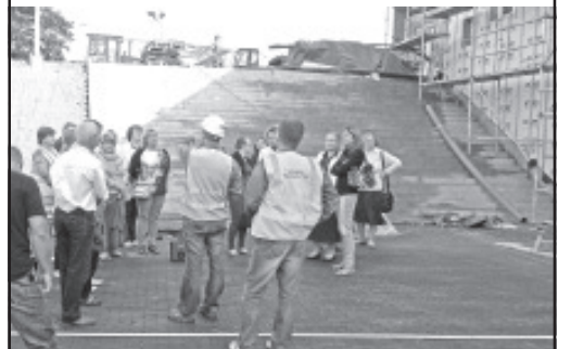
На обходе образовательного комплекса.

За две недели до начала учебного года состоялось совместное совещание работников Синимяэской школы и Вайварского детского сада с руководством волости, на котором участники собрания имели возможность познакомиться с