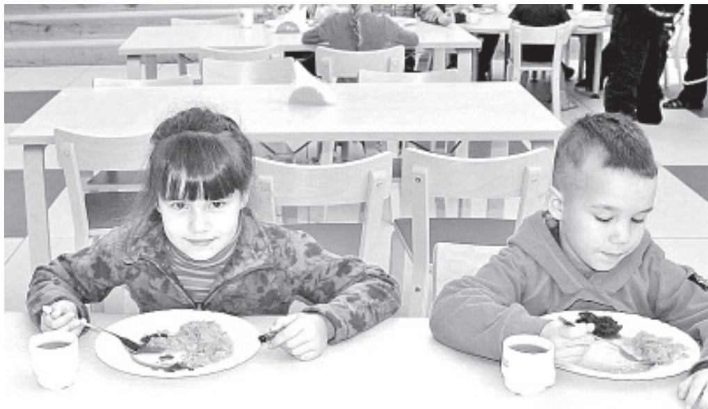
...И обедают в школьной столовой.

В Синимяэской Основной школе снова начались подготовительные занятия для будущих первоклассников, на которые мы ждем будущих выпускников детского сада. У детей есть возможность быть в роли настоящих учеников, принимать участие в уроках по разным предметам, наслаждаться школьными переменками и кушать в нашей новой школьной столовой вкусную и полезную еду. Учительницей в подготовительном классе будет нижеподписавшаяся, вместе с ней дети в школе будут учить эстонский язык, заниматься математикой, мастерить разные разности и рукодельничать, играть в игры на движение.