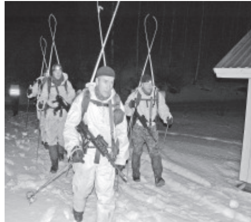
Десанту Утриа с лихвой хватило бега...

Глубокой ночью в теплой кабине автомобиля 4X4 по дороге к контрольному пункту я снова поймал себя на мысли, а как бы я чувствовал себя в лесу на вторую ночь соревнований. Ответа я не нашел, но меня охватило чувство глубокого уважения к этим мужчинам в лесу, мимо которых я проезжал. Да, в этом году в соревнованиях участвовали только мужчины. По первоначальным данным на эти