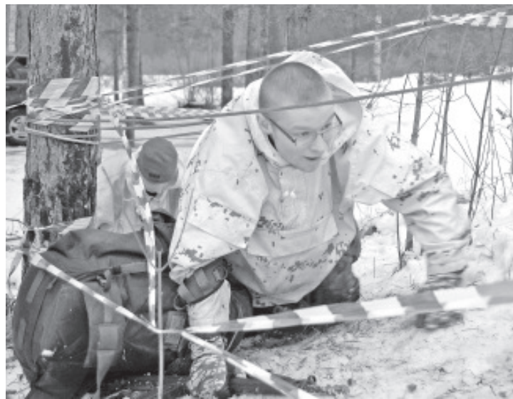
... и физических испытаний.

соревнования должна была прибыть и одна женская команда с острова Сааремаа, но планы не состоялись. В штабе несколько раз заводили разговор об отсутствии женщин. В этом году ЭТОЙ команды, за которую особенно держать палец, не было.