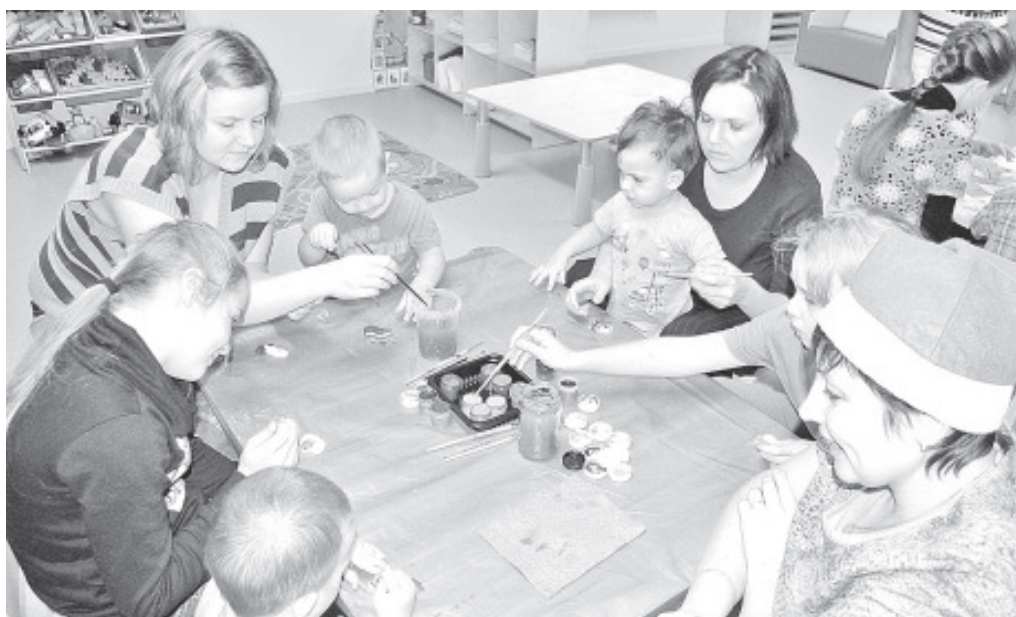
И в Синимяэ в детском саду работали тоже под руководством гномов.

уютными новыми помещениями, которые с каждым днем делаются ещё домашнее ещё уютнее.