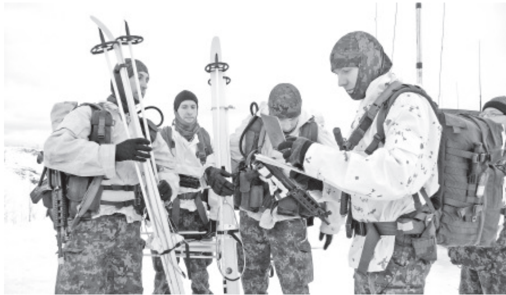
... было и над чем голову поломать...