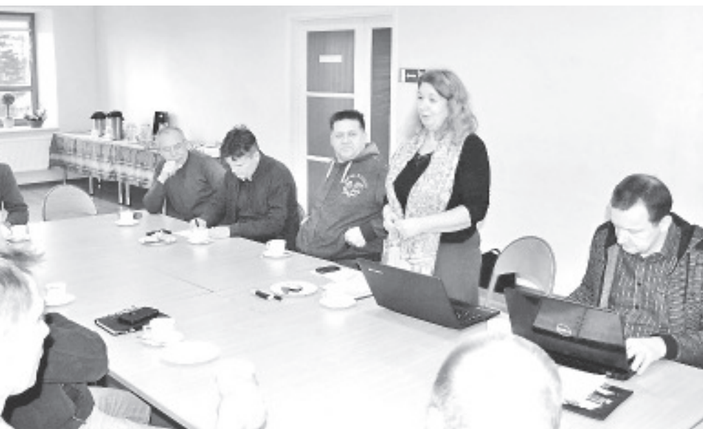
В народном доме Ваивара обсуждали программу развития музея.

сувениров. Ждут от нас и тематических мероприятий, есть возможность больше сотрудничать с Кайтселиитом. Обязательно нужно делать новые выставки, так, например, в помещениях центра по интересам можно организовать фотовыставку старых видов Ваивара. Одной из тем выставки было предложено познакомить с военной промышленностью