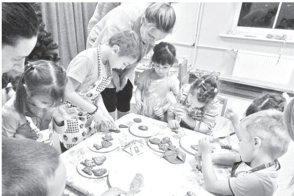
В мастерской гномов в детском саду Ольгина.

В феврале будем отмечать День Друга, Масленицу и День Независимости, так что впереди нас ждет замечательный богатый на праздники месяц. Будем много петь, танцевать, играть, кататься на санках и,