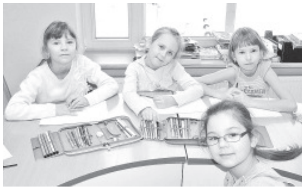
В подготовительной школе учатся...

Новый год набирает скорость, чудесные праздники остались позади. Намечены новые направления и цели, к которым стремиться. Конечно же, каждому из нас хочется, чтобы новый год был успешным и счастливым. Важно при этом не забывать, что радоваться надо каждому дню и при этом не забывать о ежедневно окружающих нас людях.