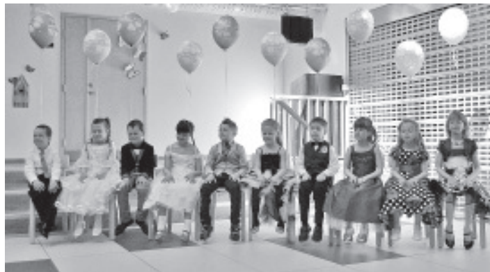
Сегодняшние выпускники.

учениками, которые иногда будут и к нам в гости заходить. Большое спасибо вам и вашим родителям – с вами было очень весело и замечательно!