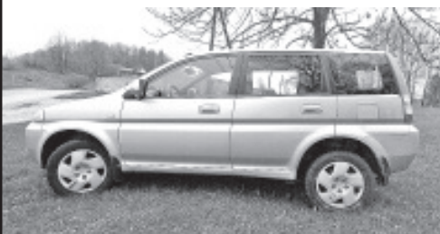
На аукционе HONDA HR-V.

Вайвараское волостное управление проводит письменный аукцион по продаже автомобиля HONDA HR-V. HONDA HR-V рег. номер 359 ASV, автомобиль, универсал, первичная регистрация - 2004, пробег 202723, двигатель 1590 см 3 , мощность двигателя: 77 kW, бензин, мануал, четыре ведущих. Начальная цена - 2500 евро. С условиями аукциона можно ознакомиться на домашней странице волости: vaivara.ee. Для участия в аукционе необходимо уплатить залог в сумме 200 (двести) евро