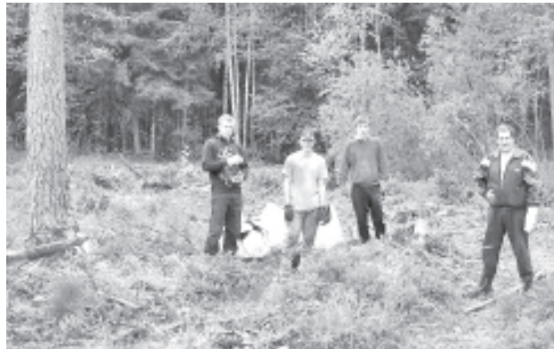
Работы в лесу.

За прошедшие осень и зиму в лесу было вырублено в общей сложности 3524 кубометров леса, что в два раза больше, по сравнению с предыдущими годами, как по площади, так и по объему. Причина в необходимости денежных средств на строительство Синимяэской Основной школы. Годами мы исходили из принципа, что после сплошной рубки леса на вырубке высаживаются или высеваются лесные культуры. Так же мы поступили и этой весной.