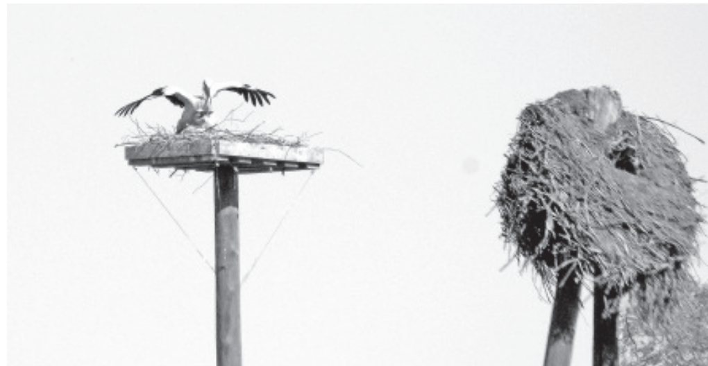
Новое жильё найдено.

повезло со своими, живущими на земле соседями, указывает и тот факт, что когда несколько лет назад в гнезде было даже четыре птенца, и стало заметно, что пернатым родителям трудно прокормить всех четверых, тогда добрые люди стали неоднократно ставить поблизости от гнезда тарелки с мясом и сосисками. Все это