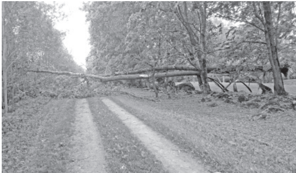
Упавшие деревья в парке Лаагна.

редкое, то приняли решение, что ситуация не аварийная и отрывать людей от дел, чтобы убрать с дороги дерево, не будут. «В пятницу утром мы с Яном оба снова были в парке. Тогда и были отмечены те деревья, которые можно и следует убрать. Кроме сломавшихся деревьев, были и еще несколько представляющих опасность деревьев, которые непременно в этом сезоне следует спилить», - сказал Лутс.