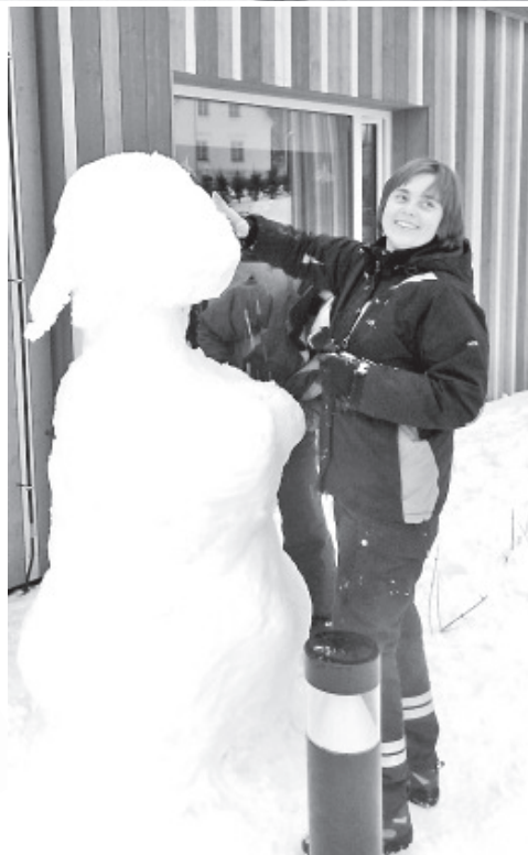
Kristi kuju saab kohe valmis.