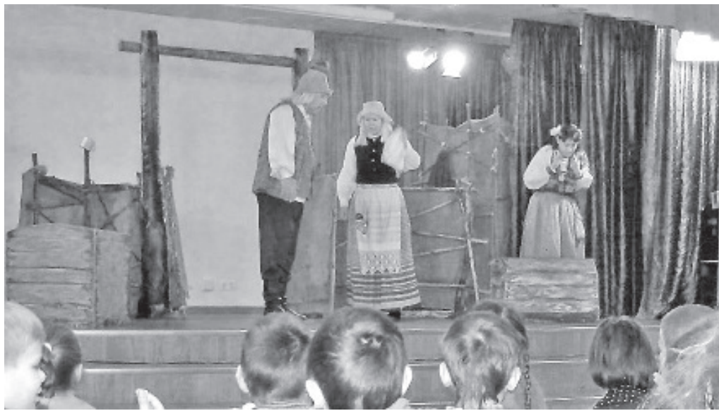
Teater Ilmarine on „Laisa Liisuga“ kõikjal Eestis külla oodatud.

ju tööd ja vaeva. Hiljem aga selgub, et vana eideke oli tegelikult haldjas ning vana taadike võlur. Maag ja haldjas otsustavad tütarlapsele õppetunni anda ning võluvad ta kõigepealt väga range perenaise ja peremehe juurde taluteenijaks ning lõpuks peab neiu olema hoopiski teenija rollis. Kahjuks aga ei muutunud Liisu töökaks, sest ta ei osanud ju midagi teha.