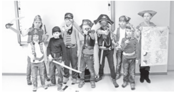
Sõbrapäevalt ei puudunud ka piraadid.

Ei puudunud meie peolt ka piraadid, võrratutes kostüümides, kes samuti õnnitlesid kõiki sõbrapäeva puhul ja esitasid