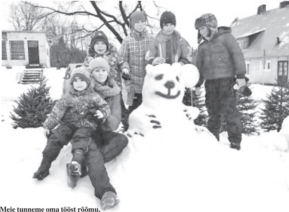
Meie tunneme oma tööst rõõmu.

Suur tänu teile kõigile, kes veetsite selle päeva koos oma pere, sõprade ja meiega lumelinna ehitades! Suur aitäh Alarile kuulutuse eest! Suur aitäh kõigile kambalistele, kellel jagub kuhjaga põnevaid