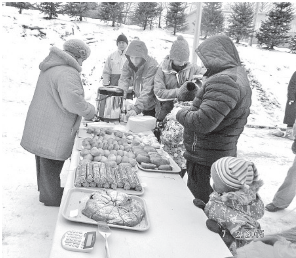
Kehakinnitus kulub marjaks ära.

ideesid ja aktiivsust! Kambas on vahva ja tulemus fantastiline!!! Usume ja loodame, et kooli ja lasteaia lapsed saavad veel kaua lumelinnas mängida ja seda edasi arendada. Lasteaia väravasse tehti ka uhke „Memm“, kes kõike ja kõiki valvama pidi. Pilte saate vaadata Vaivara valla kodulehel.