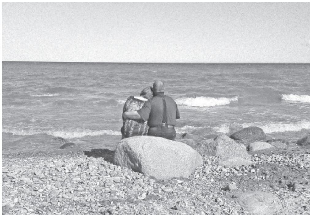
Auhinnatud foto „Jalutuskäik mere ääres.“

eesseisvat tegevistest, sh Olgina alevikus toimunud parklate planeeringust, kohtuistungitest, mis on toimunud nii kooli ehitajaga kui ka kindlustusega. Kui BTA Kindlustus peaks esitama kompromisettepaneku, siis vajadusel kutsume sellel aastal kokku volikogu istungi.