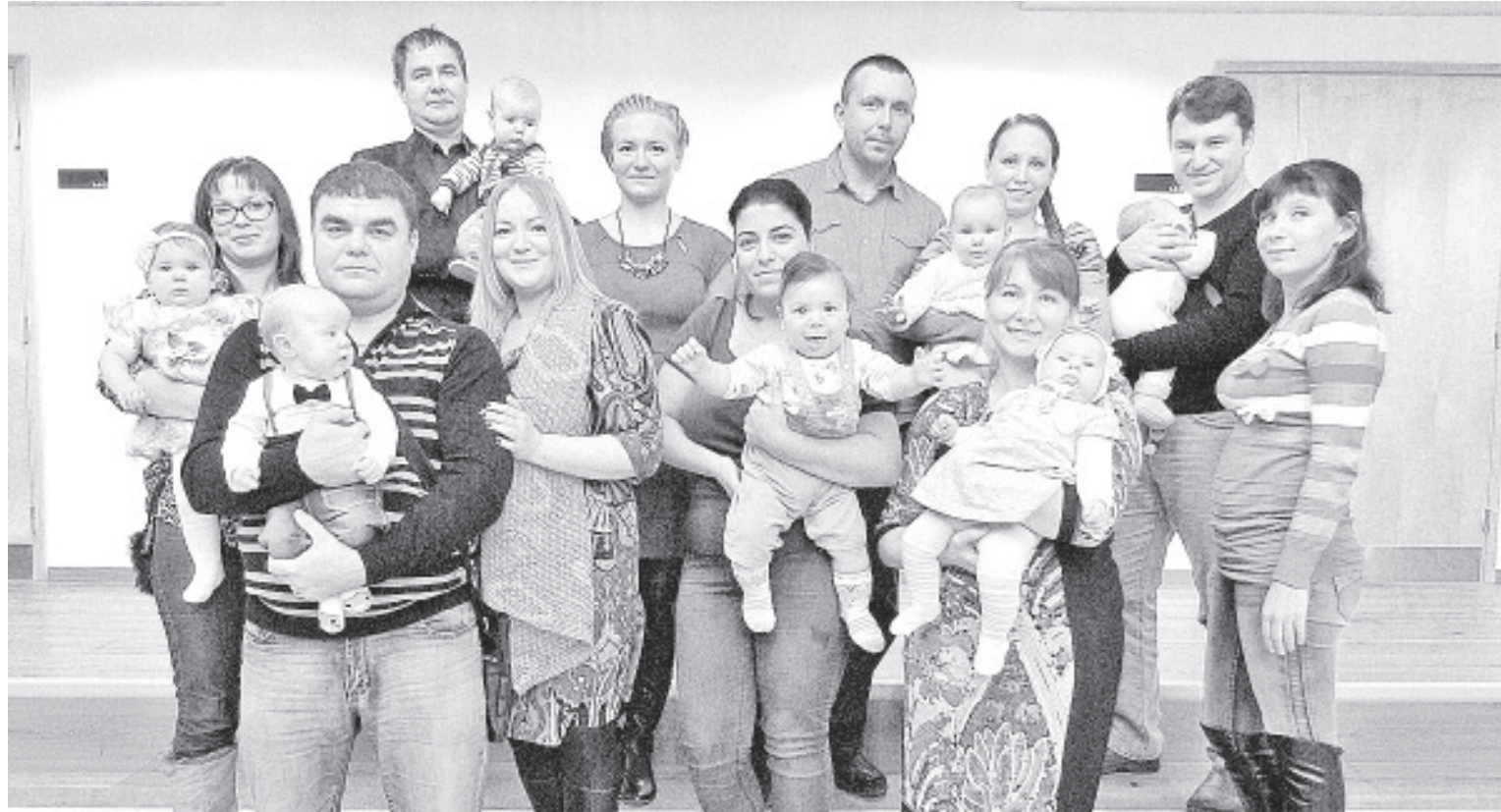
Uued vallakodanikud koos vanematega.