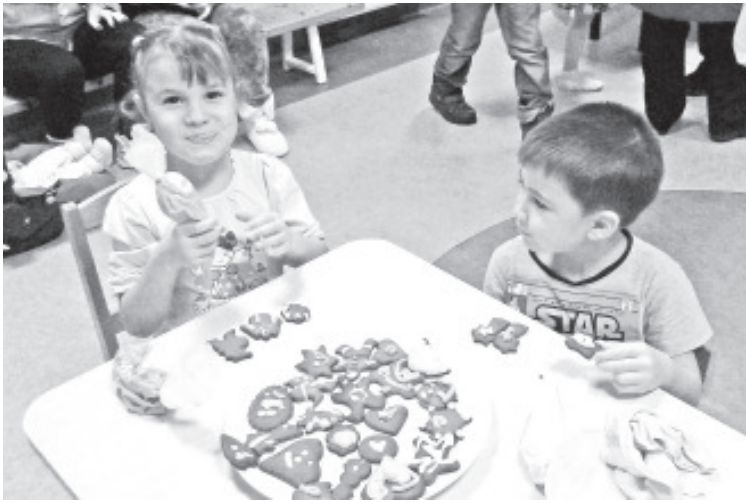
Piparkookide valmistamine Olgina lasteaias.

Detsember algas põnevate ettevalmistustega jõuludeks – valmistume jõululaatadeks ning päkapikkude töökodadeks, otsime kuhu on end peitnud päkapikud ja