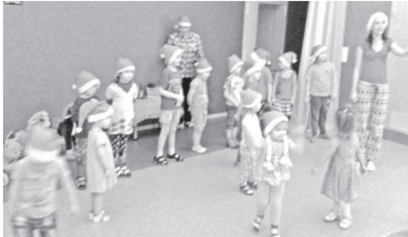
Pisikesed päkapikud Sinimäe lasteaias.

jõulumees, teeme piparkooke ning õpime laule, tantsu, luuletusi! Sel aastal toimus meil lasteaias Päkapikkude töökoda koos jõululaadaga nii Sinimäel kui ka Olginas.