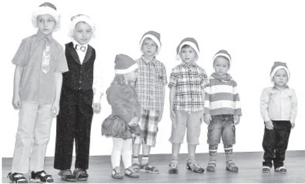
Esinemisyrg on lasteaias päkapikkude käes.