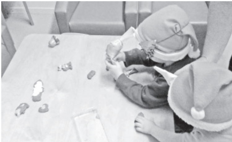
В детском саду в Синимяэ идет приготовление печенья «пипаркоок».

Наши дома были украшены уже в первый адвент и выглядят нарядными рождественскими домиками – повсюду украшения и рождественские огни, запах рождественского