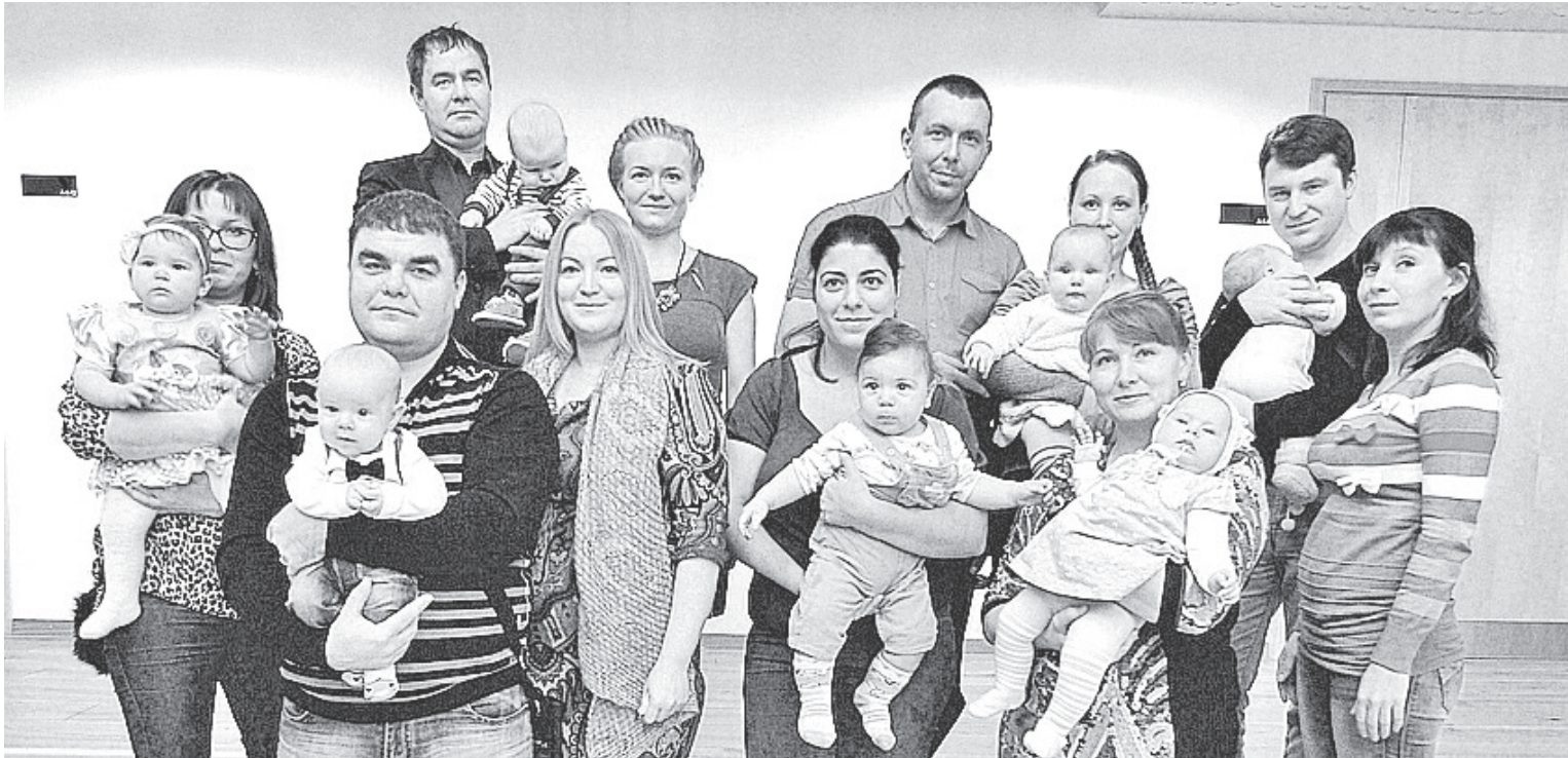
Новые граждане волости вместе с родителями.

И добро пожаловать в музей! ЕКАТЕРИНА МУРАВЬЁВА 392 4634 Vaivara Sinimägede Muuseum