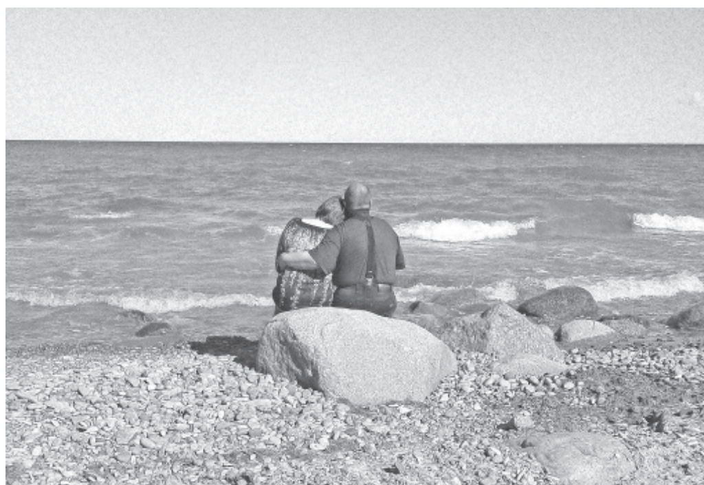
Отмеченная наградой фотография «Прогулка у моря»

собрания по поводу состоявшихся и предстоящих дел, в том числе и о планировке парковочных мест в поселке Ольгина, и о пошедших судебных заседаниях, как со строителем школы, так и со страховщиком. Если страховщик «BTA Kindlustus» подаст компромиссное предложение, то, в случае необходимости, в этом году соберем волостное собрание.