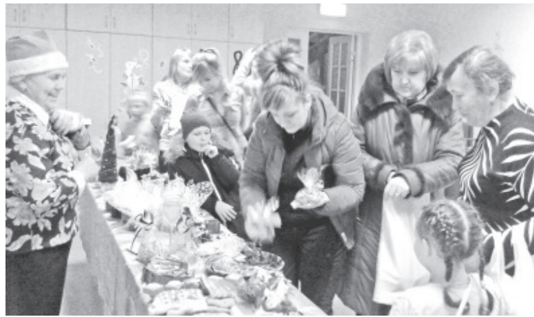
На недостаток покупателей на рождественской ярмарке жаловаться не приходилось.

Деда Мороза, готовили «пипаркооки», а ещё разучивали песни, танцы, стихи! В этом году у нас в детском саду мастерская гномиков проходила вместе с рождественской ярмаркой в