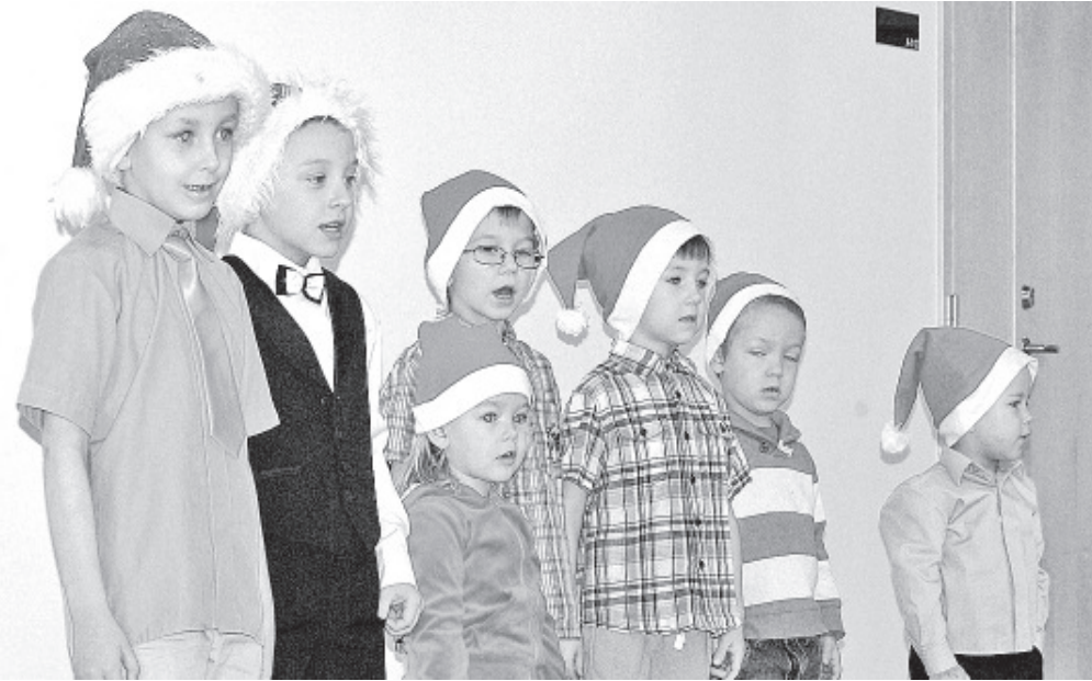
Очередь выступать гномикам детского сада.

СПОКОЙНОГО РОЖДЕСТВА, СВЕРКАЮЩЕЙ СМЕНЫ ГОДА И СЧАСТЛИВОГО НОВОГО ГОДА! Волостное Собрание и Волостное Управление