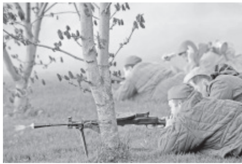
Сражение в музейную ночь в Синимяэ.

Месяц май начался с темы дня матери, и, конечно же, мы его отметили праздниками. Дети готовили подарки, рисовали, разучивали песни, стихи, танцы. В Ольгина праздник, посвященный дню матери вместе с днем открытых дверей прошел 7 мая, и 8 мая он состоялся в