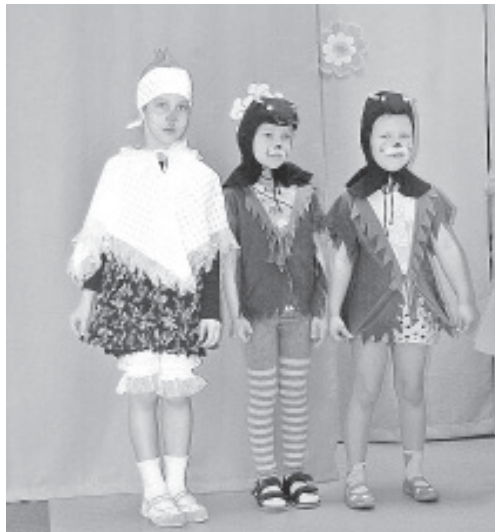
День матери в Ольгина.

А сейчас мы заняты очень срочным делом, приближается самый главный (и самый грустный) праздник года. Это день, когда мы своих ребяташек провожаем в