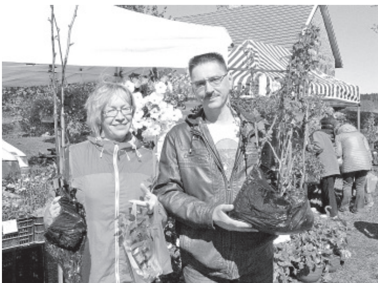
Фоторепортаж с юбилейной ярмарки Ванатаре.