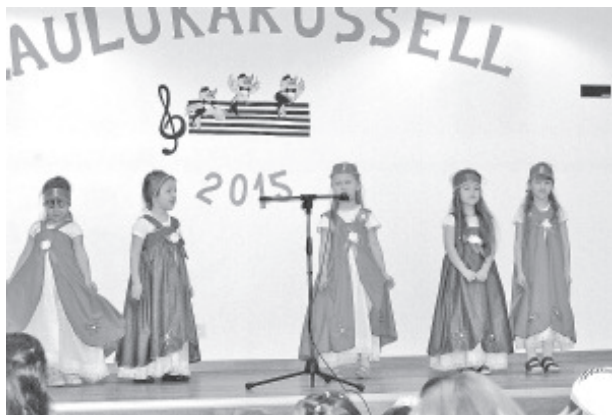
Песенная карусель 2015.

За исполнение песни с музыкальным сопровождением первое место жюри присудило Маргусу с бабушкой за песню «Моя песенка»; второе место получили Вероника с мамой за песню «Маленькая Лийз играет в магазин» и третье место дали