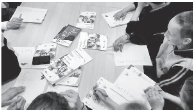
Семинар по карьере в Нарве.

в дружину школьников уже, конечно же, успешно пройден, так как срок подачи документов с 20 апреля по 18 мая. За тем последовало собеседование и тур работы в команде и в Синимяэ и в Ольгина. К, сожалению, в отряд дружины попадут только 15 школьников, у которых, как минимум, удовлетворительные успеваемость и поведение.