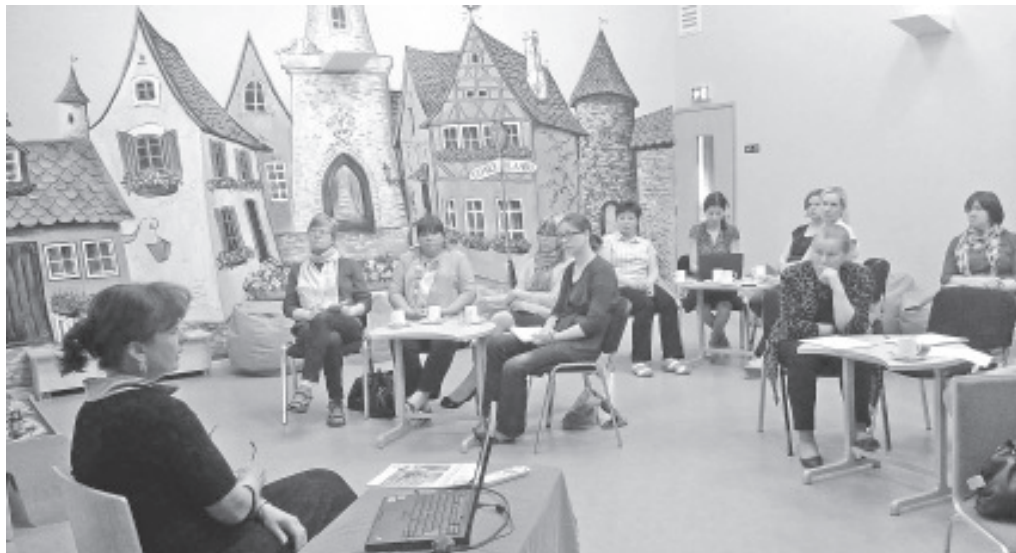
Учителя детских садов в Вайвараском детском саду в Синимяэ.