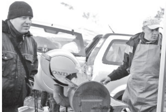
Toitu valmistati ka kohapeal.

on valesiti valitud riietus, said oma ostud kenasti sooritatud. Tundus, et ka kaupmehed olid müügiga rahul ja suurem osa kaasa võetud kaubast leidis uue omaniku.