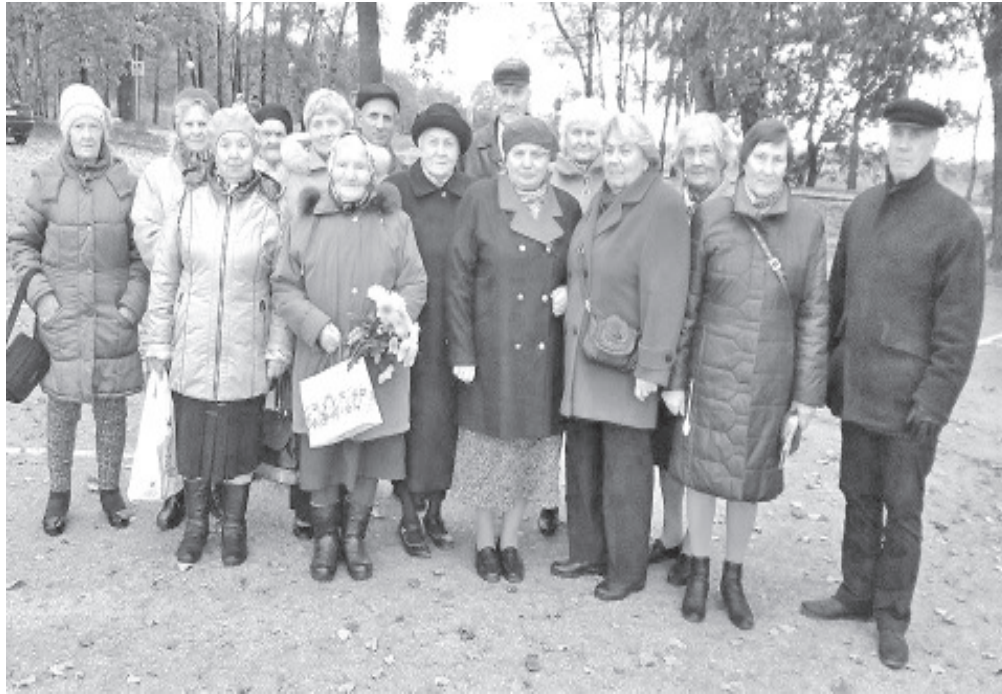
Vaivara valla eakad Jõhvi kontserdimaja juures.

sotsiaalosakonna juhataja ülesannetes KEIO SOOMELT huvikeskuse juhataja