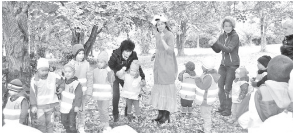
Lasteaia mudilased sügispeol Toilas.

Sügis on imeline aasta-aeg ja sellel aastal on ta eriti ilus. Nii mõnus on õues jalutada ja lehtedes sahistada – õnneks lasteaia on võimalik õue nautida lausa kaks korda päevas! See õppeaasta on alanud meil väga kiirelt ja toimekalt ning tundub, et me oleme sellega juba ära harjunud, sest muudkui leiutame uusi põnevaid asju.