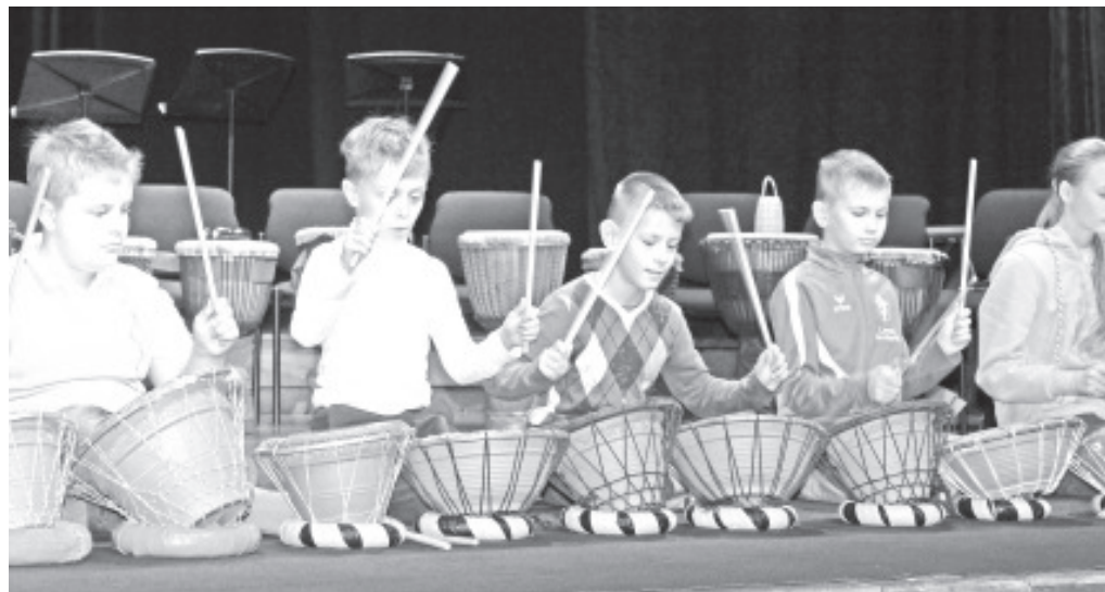
Kõike seda, mida suuga ütleme, on võimalik mängida trummidel...