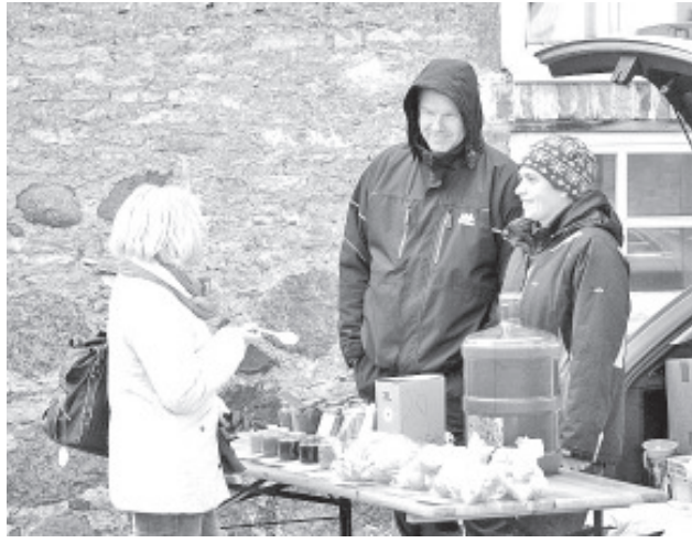
Kaup lettidel oli kõik kohaliku päritolu.

Need laadalisel aga kes teadsid, et pole halba ilma, vaid