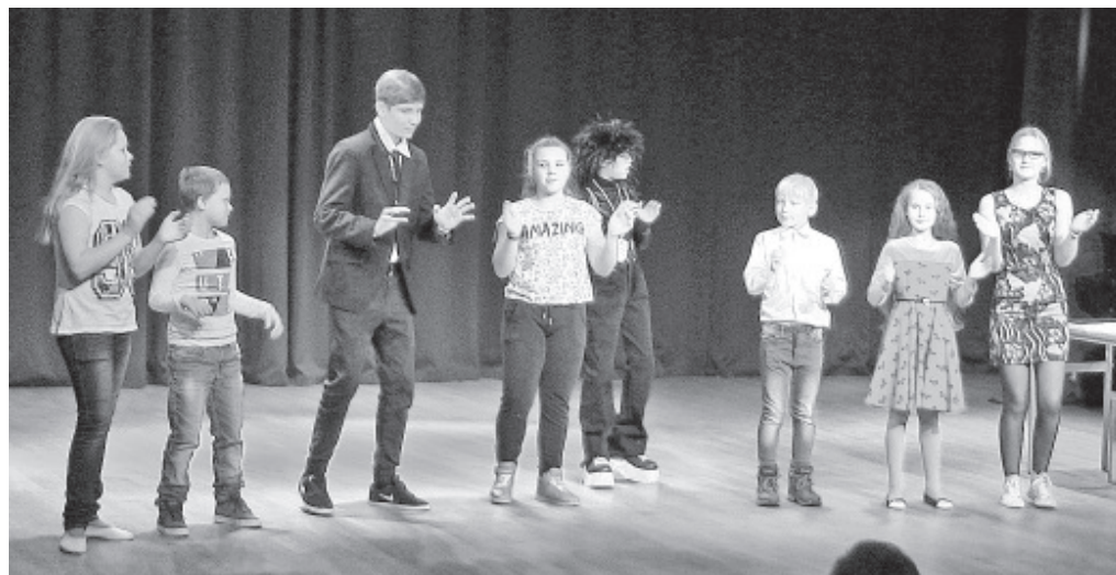
выступление на «Ералашке».

Ребята с этой сценкой выступали и на концерте ко Дню Пап в Н/Д Ольгина, где сорвали море аплодисментов.