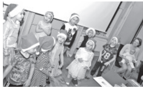
Детсадовские малыши выступают перед младенцами.

вспомнить, как прошел этот уходящий год. У нашего детского сада он был замечательный и интересный: у нас много друзей, и мы всех вас, наши друзья, очень любим! Приглядывайте за нами, ведь вместе еще веселее!