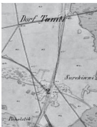
Немецкая карта 1868 года, на которую нанесена деревня Тамби (Dorf Tamby).