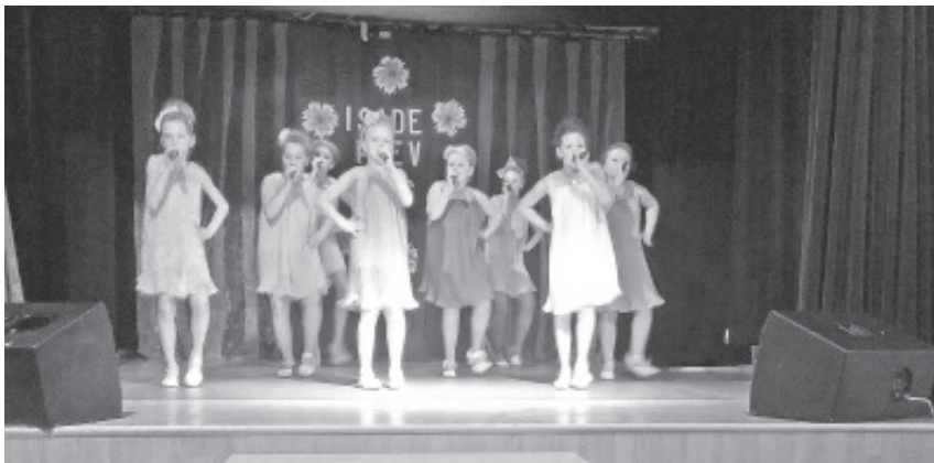
На Дне Отцов в Ольгина.