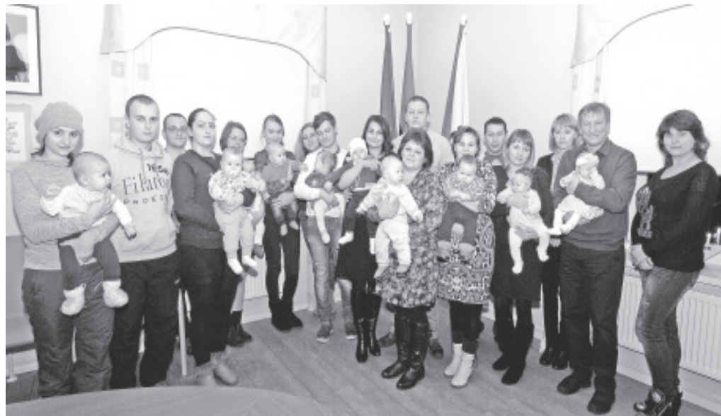
Новые граждане волости вместе с родителями на приеме.

Подарки для героев дня были и у детского сада. Вручая эти подарки вместе со своими помощниками – гномиками