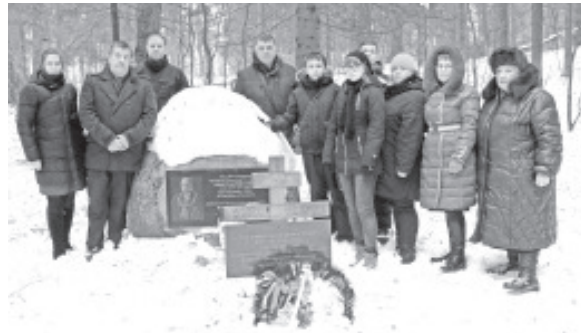
У памятного камня президенту Эстонии Константину Пятсу.

На третий день нашего пребывания в Тверской области была организована поездка