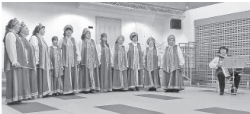
Ансамбль «Ивушки»

Творческая история «Ивушек» многосторонняя и плодотворная. Коллектив