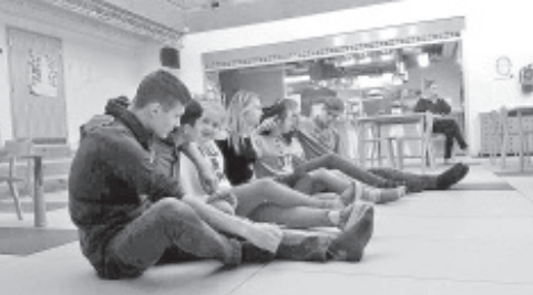
На молодежной встрече в Вайвара.

Молодежь вместе изготовила фильм о центре отдыха Таеваскоя, где они занимались экотуризмом в августе. Кроме того учились снимать интервью, играли в командные игры, улучшили навыки общения на другом языке, потренировались в брейк-дансе, дали обратную связь о проекте, чтобы в следующий раз провести его еще лучше. Участники отмечали, что успешно