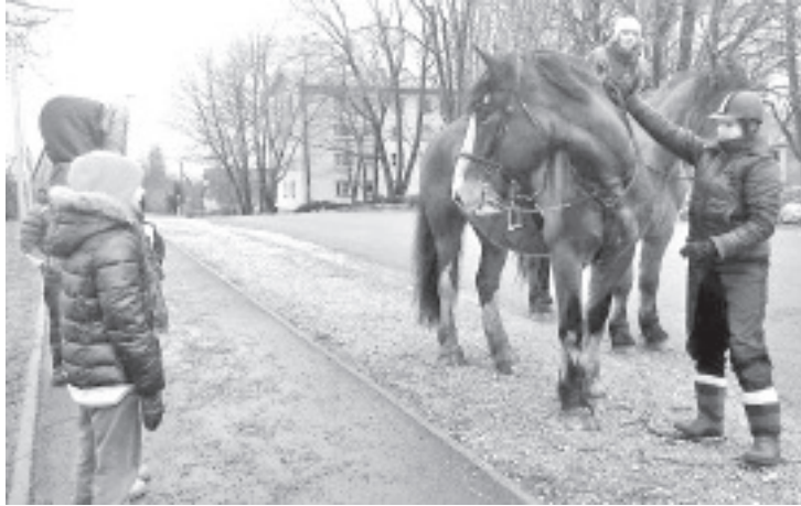
Vastlapäeval sõideti seekord hobustega.

vastlapäevaliste meeleolu „õigele lainele“ häälestada aitasid „Ivuški“ poolt esitatud vastlatalaulud.