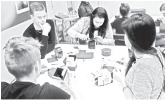
Käsil on nõelaugukaamera valmistamine.

Töötaos tutvusid meie õpilased fotode tegemise tehnoloogiaga. Igaüks tegi enda kättega Pinhole kaamera ehk nõelaugukaamera. See on kõige lihtsam objektiviita fotokaamera. Selle võib igaüks ise endale meisterdada, kas kingakarbist, plekkpurgist, filmirullitopst või millest iganes. Kuigi pinhole kaameraga pildistamine ei pruugi pakkuda tehnilist kvaliteeti ja kasutam mugavust, mida pakub tänapäevane digitaalne tehnoloogia, on see