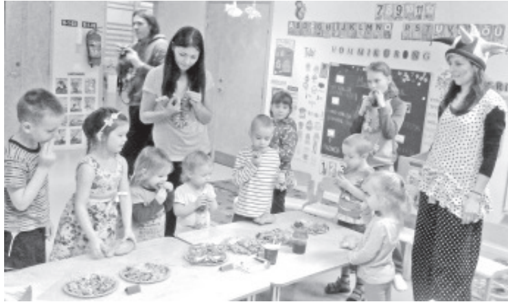
Vastlapäeval Sinimäe lasteaiaas pannkookidega maiustamas.

See aasta on kahjuks aga väga viiruste rohke ning sellest tingitult palume teil kõigil end veel rohkem hoida ja jälgida, et haigena püsiksite kodus.