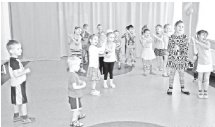
День друга в детском саду в Ольгина.

И ко всем этим праздникам нужно подготовиться: разучиваем песни и танцы, учим стихи и мастерим подарки и открытки, играем и, конечно же, угощаемся тортом. С большим нетерпением ждали масленицу с ее весёлыми катаниями и снежными баталиями. Но погода распорядилась по-другому: ни снега, ни катания с горок. Но надеемся, что устроенное нами веселье, гарантирует нам удачу в будущем! Это большое счастье, что в нашем детском саду так много детей, вместе с которым дни проходят так быстро и весело. У нас самые прекрасные родители и учителя! Большое спасибо вам всем! К, сожалению, в этом году так много разных вирусов и поэтому мы