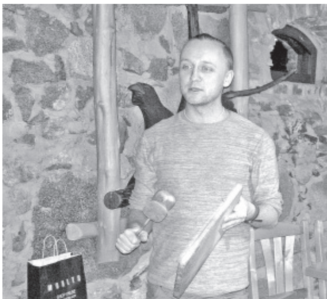
С каждой выставленной на аукцион вещью подробно знакомили.

В декабре прошлого года для членов волостного собрания, служащих волостного управления и руководителей волостных учреждений был организован инфодень на тему административной реформы. На проходившем после продолжительного и очень серьезного информационного дня ужине вместо традиционного обмена подарками друг с другом был устроен аукцион, на который каждый из присутствующих пожертвовал какую-либо вещь. На аукцион поступил разный товар – начиная от электрических бытовых приборов и заканчивая вареньем домашнего приготовления. Собранную от продажи на аукционе сумму в размере 400 евро(!) передали в поддержку живущих в детском доме детей Вайвараской волости.