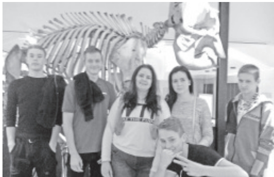
Музей природы Тартуского Университета.

Последнее познавательное мероприятие ждало нас в малом зале театра Ванамуйне. На