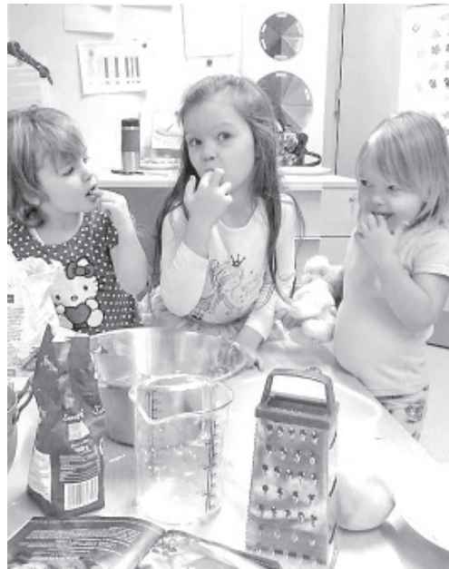
День друга в детском саду в Синимяэ.