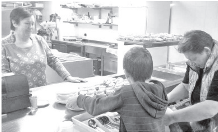
На Масленицу угощались булочками со взбитыми сливками.

Под крышей Синимяэской основной школы проходили игры и конкурсы, а угоститься горячим чаем с масленичными булочками два раза приглашать не приходилось, эти булочки были готовы съесть глазами еще на подносах. Звучала музыка, и