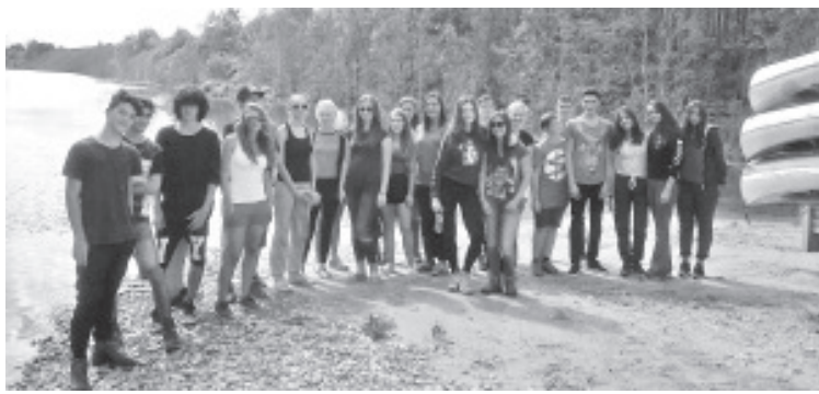
Noored vabatahtlikud ühispidil.

Korrastati Sinimäe õunapuuaeda, toimetati muuseumi, noortekeskuse, jalgpalliväljaku ja lasteaia juures, õpiti tsemendi valamist ja lõkke süütamist – viimane valmistis suurt elevust Pariisist ja Hong Kongist pärit tüdrukutele, kelle jaoks oli see esmakordne kogemus. Tööst vabal ajal käidi sõitmas kanuudega, Eesti Kaevandusmuuseumis, Alutaguse Seikluspargis, tutvuti Narva