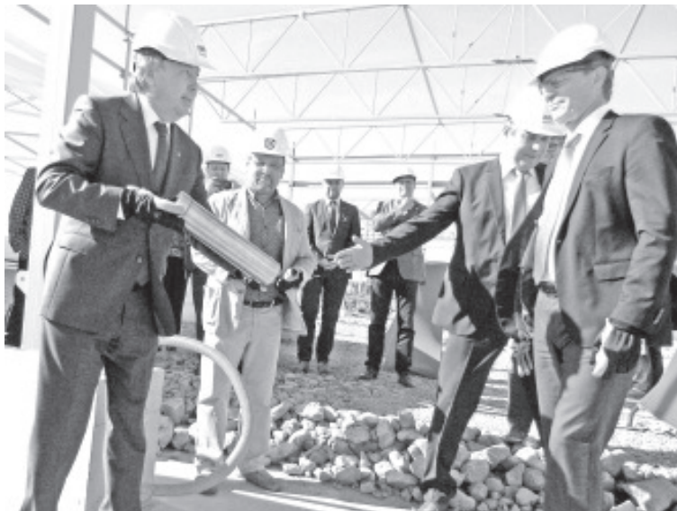
Toyota keskuse nurgakivi panekul.

Valdik Uski sõnul on rajatava keskuse oluliseks eesmärgiks olla läbipaistev ja avatud – seda nii enda ärimudeli,