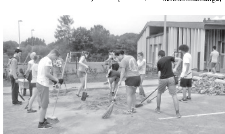
Suvepäevalised tööhoos.

Selisoo matkarajal tutvuti nii looduse kui muutliku ilmaga, grilliti ja esinemis- ja tantsuoskus pandi proovile Playbackis. Korraldati erinevaid meeskonna- ja seltskonnamänge, vihmased päevad sisustati koolis põnevate katsete tegemisega, näiteks valmistati ise seepi. Igal õhtul toimunud kultuuriõhtutel vaadati pilte, kuulati muusikat ja valmistati erinevate riikide roogasid. Paaril korral toimus lasteaias filmiõhtu - tänu Margitile, kes võimaldas kasutada lasteaia ruume.