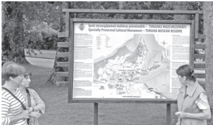
...ja kuulati kohalike giidide kaasahaaravat juttu.

Peale Jürmalat seadsime sammud Lidosse, mis on kuulus mitmekesise toidu valikuga ja nagu giid ütles, väga soodsate hindadega. Hindade kallidus ja odavus on küsitav, aga ruumi oli seal palju. Läti nokia võiks selline asutus kindlasti olla. Peale