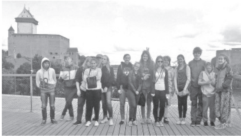
Noortekohtumisest osavõtjad Narvas.

Esimene kohtumine toimus Harjumaal, Naissaarel, kus noored tegid erinevaid tööühte, mängu ja kasutasid aktiivõppe erinevaid meetodeid, nagu improteater, foorumteater, rollimängud. Eriti meeldis noortele kohtumise paig, sest varem ei olnud keegi neist Naissaarel käinud.