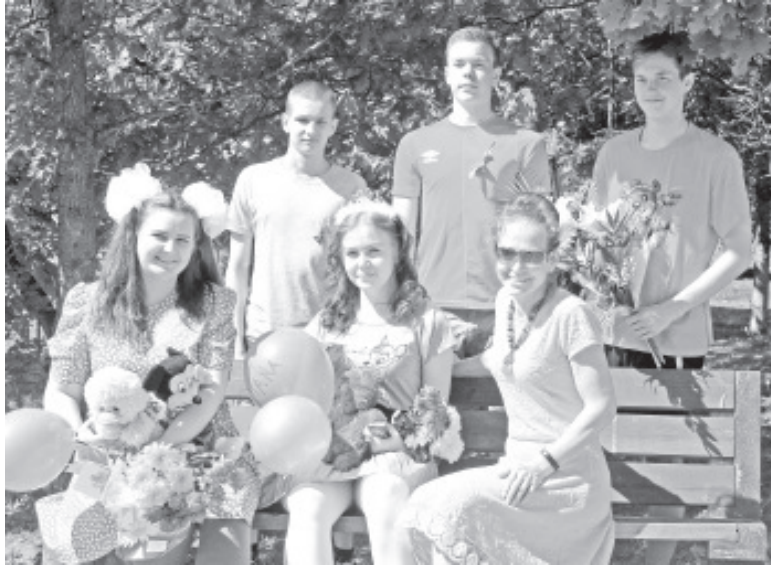
Eesti osakonna lõpetajad.