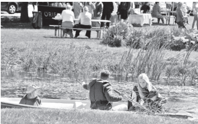
ja sõideti paadiga.

Terve päev toimus ka registreerimine ning päeva lõpuks oli meil kirjas peaaegu 300 inimest. Ja teame kindlalt, et väga paljud registreerima ei jõudnud, seega super tulemus!!! Suur, suur aitäh kõigile – tore oli veeta see päev