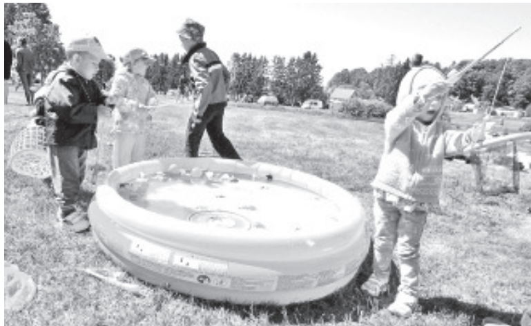
... püüti kala ...

Paintball, ATVd; paat koos paadimehaga; märgimasin; väikestele lastele oma basseini, koos kalapüügiga; spordimängud, kabe ja loomulikult kalapüük! Sel aastal oli meil kaks tublit piigat, kes koos püüdsid ligikaudu 50 kala!