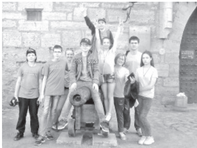
Meie keekekümbelõpilased Leisis.

tunnis. Õppisime tantsima Karja-Jaani ja mängima kannelt. Õhtuti mängisid noored ühiselt jalgpalli ja uka-ukat ning muid mängu. Põnev avastus noorte jaoks oli see, kui nad