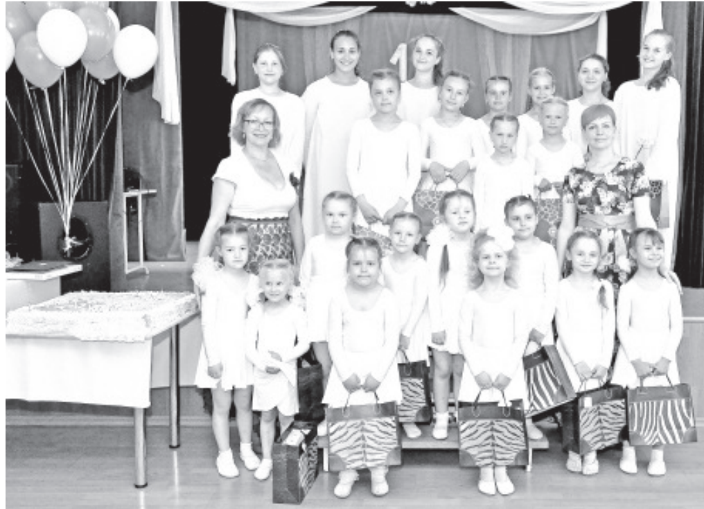
„Aksent“ tähistas oma 15 tegevusaastat.

Vaid mõned fragmendid alates 2015. aasta sügisest ja lõpetades kevadel 2016.