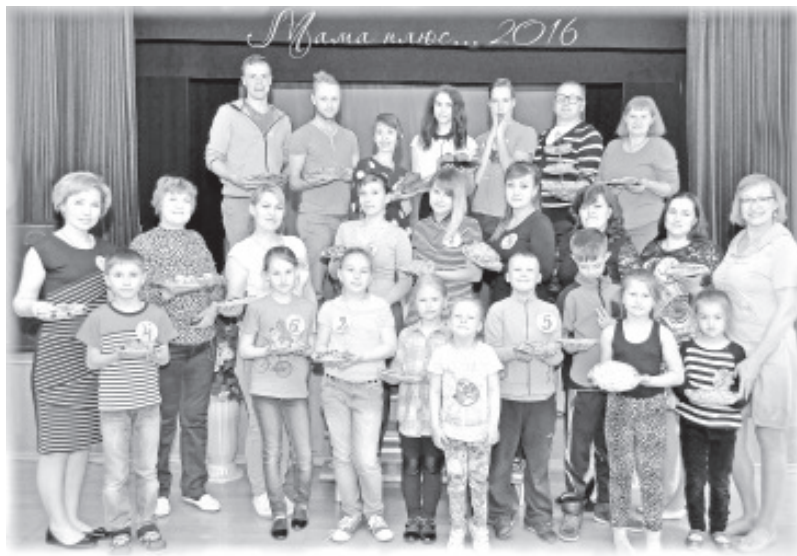
Projekti „Ema +“ lõpupeol.

Elu ei seis paigal, hooaeg asendub uuega ja Vaivara huvikeskuse kollektiiv