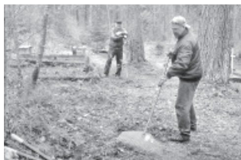
Talgupäeval kalmistul.

Kuna tööga sai juba kell 10.00 algust tehtud, siis lõunaks korjasime meie rehad, labidad