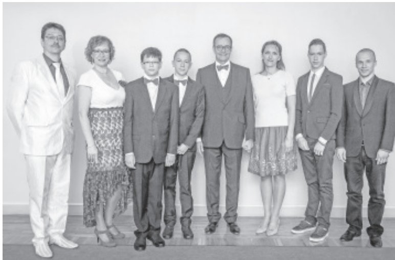
Presidend vastuvõtul.

Narva Soldino Gümnaasiumis õppivad lapsed on ema eeskujul aktiivsed valla