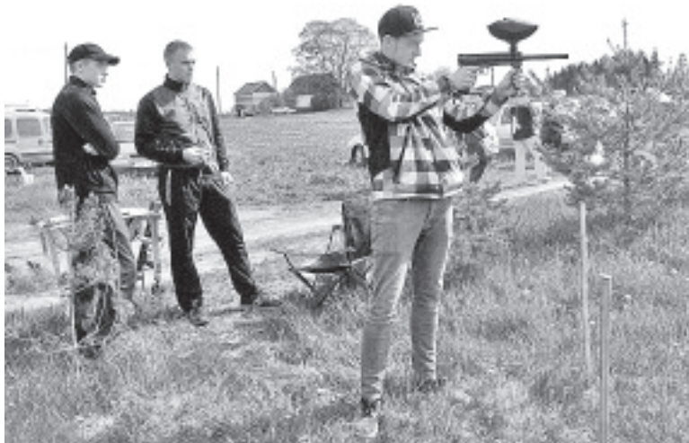
Laadal sai ka märki lasta.

Ka ostjaid liikus, kuigi kohati jäi mulje, et inimesi on ohtralt, aga kaupa nende käes kasinalt. Kindlasti oli selle põhjuseks tõsiasi, et laatasid on kevaditi peaaegu iga päev ja üllatada millegi põhimõtteliselt uuega on keeruline. Seda enam, kui oleme ise kehtestanud reegli, et peame ikka maalaata, mitte riideturgu. Käsitöö on loomulikult iseasi, seda võiks rohkemgi ja