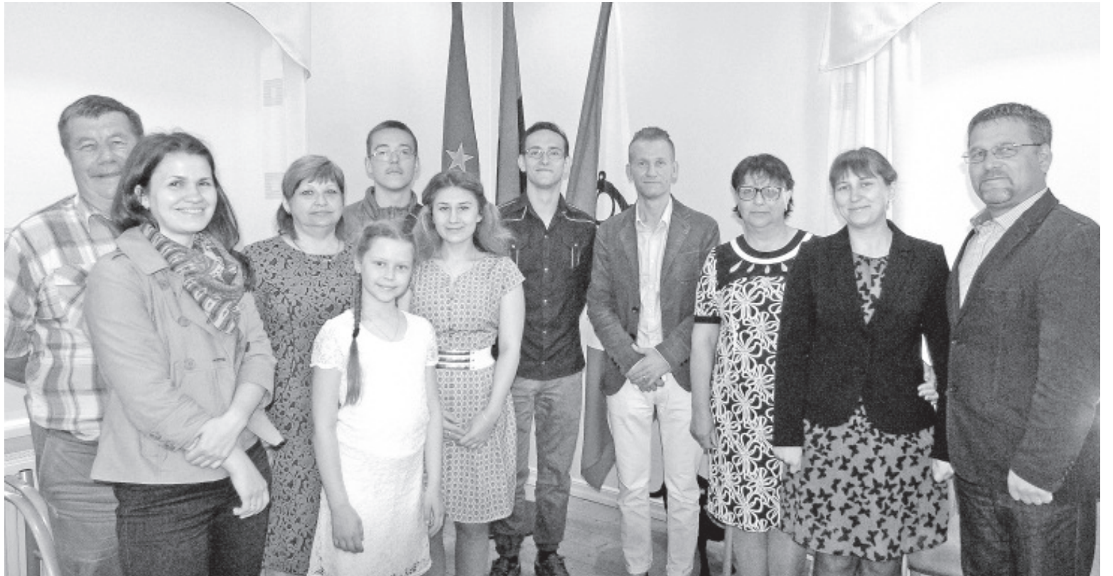
Külastajate Buraševost.