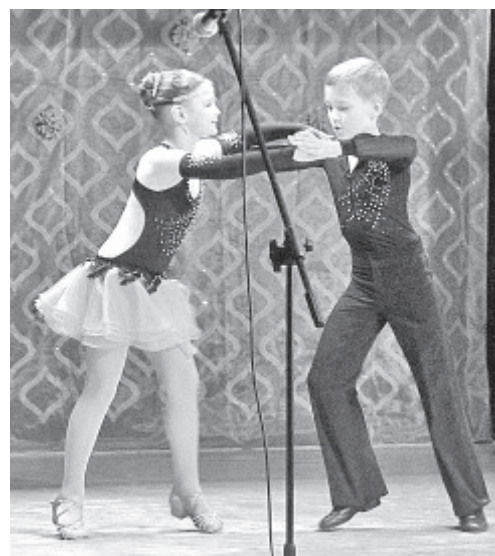
Esinemisejärg on peotantsijate käes.