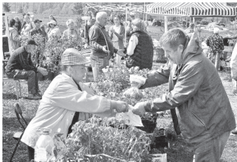
Laadal müüdi-osteti ja aeti ka niisama juttu.

Laat algas sellel aastal samal ajal, mis alati, kui formaalselt lähtuda. Tegelikult läks kõik tund aega varem lahti ja samavõrra varem ka tegelikult lõppes. Kaubeldi seega sama kaua ja võiks vist öelda, et juba tavapäraseks saanud kaupadega. Mida sa kevadlaadalt ikka saada loodad kui mitte istikuid, juur- ja puuvilju ning käsitööd.