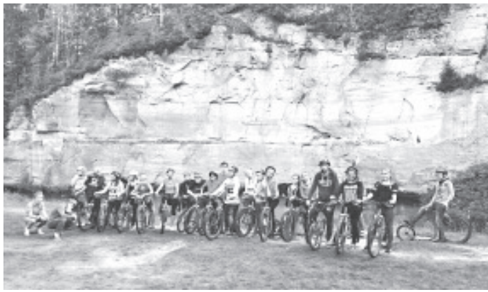
Noored imekaunis Taevaskojas.

Selle projekti teine kohtumine toimub oktoobrikuus meie vallas, Olgina külas. Seal me teeme valmis filmi, mille jaoks filmisime materjali