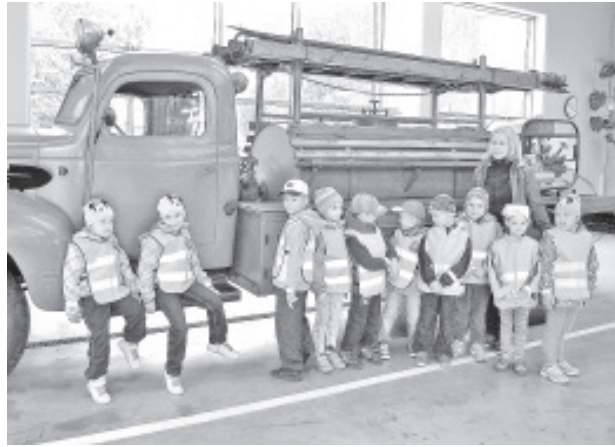
Külaskäigul Narva Päästekomandos.