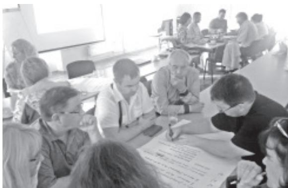
Elav arutelu läbirääkimistel.

parema elukeskkonna loomise poole. Olulise ühise eesmärgina nimetati ka ettevõtluse arengu toetamist, sh turismi arendamist.