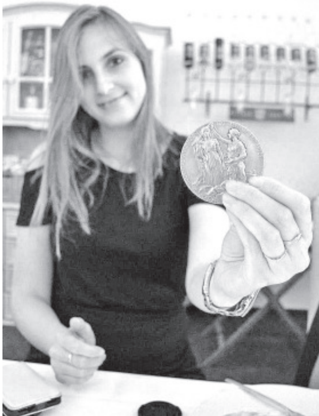
„Nüüd saan öelda, et ma sain Nobeli preemia ... kaheks minutiks.“

Enda Tartu ja Turu ülikooli vahel jagamisest räägib Tarkanovskaja: „Turu ülikooli materjaliteaduse töörühmaga alustasime me koostööd minu doktorantuuri alguses, nimelt kasutasime nende teadusaparatuuri erinevate ioonsete vedelike fragmentatsiooni protsesside uurimiseks kiirekanali Lundis (Rootsi). Samuti olin kaasatud Turu ülikooli materjaliteaduse töörühma biomolekulide ja molekulaarsete klastrite sünkrotron-mõõtmistesse Lundis. Osalesin ka tulemuste andmeanalüüsil. Sügava koostöö tulemusena otustati sõlmida eelmisel aastal Turu ja Tartu ülikoolide vahel koostööleping, et mul oleks võimalik oma doktoritööd kaitsta mõlemas ülikoolis ja saada kahe ülikooli doktorikraad.“ Sinimäe Põhikoolis üheksa aastat