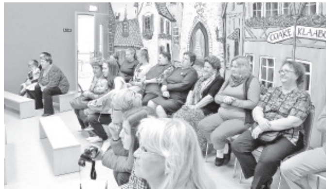
Vanavanemate päeval Sinimäe lasteaia.

8. septembril läks veelgi huvitavamaks. Juba aastaid võtame osa RSK Jõhvikas korraldatud orienteerumiseljapäevakust, mis toimub Sinimäel. Lapsed väga evelil ja õpetajad muidugi ka. Jooksurid selga ja kohale. Onu andis igale lapsele oma kiibi ja kaardi. Ühiselt läbisime raja, mis oli mitmes kohas pisikeste jaoks paras väljakutse! Super, et selliseid üritusi meie kandis