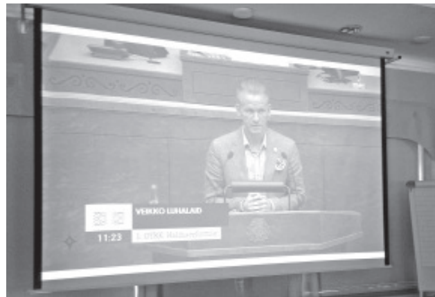
Riigikogus toimuvat jälgiti vallamajas suurelt ekraanilt.

inimeste tulek tänu riigiametite, riigiasutuste ja julgeolekuasutuste tulekule Ida-Virumaale oleks kindlasti elavdanud seda piirkonda.