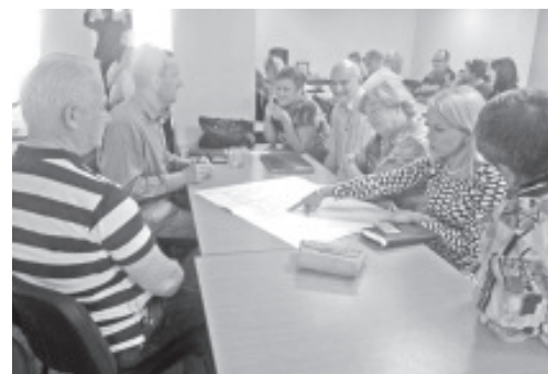
Оживленная беседа на переговорах.

Для координации дальнейших действий в переговорах по объединению самоуправления