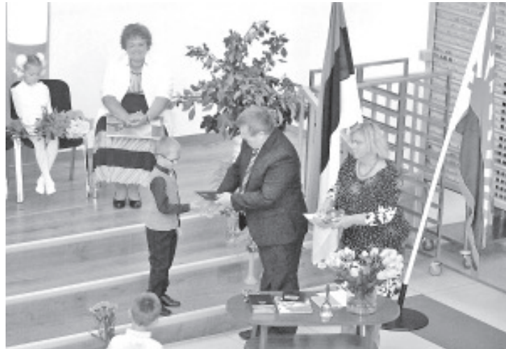
Рукопожатие директора закрепляет прием в школу.

«Иметь в кармане важный диплом, еще не значит быть образованным человеком. Деловые люди это те, у кого есть знания, навыки, опыт ... и, что все это помогает им в принятии правильных деловых решений. Такой человек умеет думать своей головой, не наносит вреда ни себе, ни другим людям и успешно справляется с жизнью», - сказал руководитель школы, подчеркнув, что в первые годы