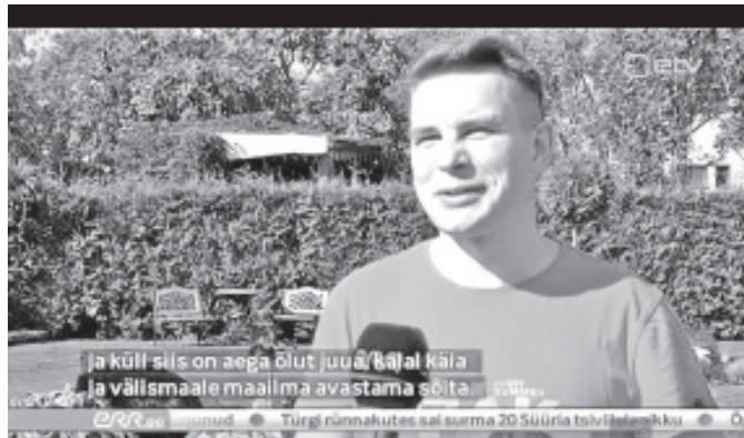
Отец семейства на телепередаче.

«От всего этого моя доля составляет, быть может, лишь только десятую часть. А девять десятых это вот ее рук дело», - похвалил свою супругу работающий на