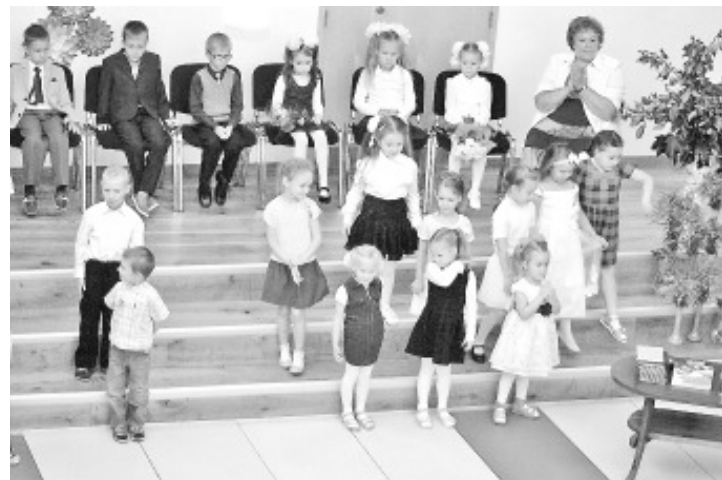
В первый школьный день звучит приветствие и ребятшек детского сада.

независимости Эстонского Государства, люди, закончившие три – четыре класса сельской школы говорили на трех языках и успешно справлялись с работой в городе. Директор выразил надежду, что сегодняшние ученики основной школы такие же молодцы и так же успешно будут справляться в своей будущей жизни, и будут уметь принимать правильные решения и делать правильный выбор».