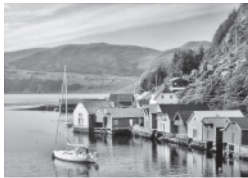
Pilt näitusel imekaunist Norra loodusest.

Narva-Jõesuu valges saalis toimus 1. oktoobrist kuni 29. oktoobrini näitus „Norra värvid“. Norra, mille nimi tähendab tõlkes „teed põhjapool“, on kontrastide maa. See on ilus ja ebatavaline maa ning Põhja-Norras on tänu keskööpäikesele ka suveööd valged. Norra talv on aga üldiselt pime ning taevakaar muutub heledamaks ainult lühikeseks ajaks. Rannajoont ääristavad