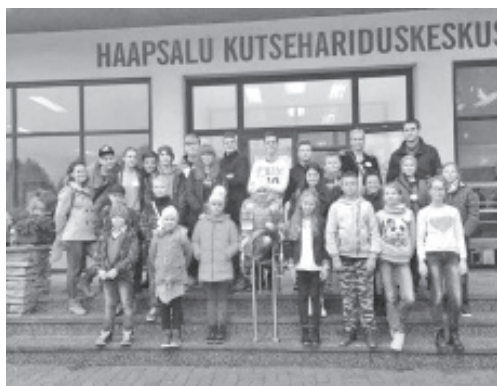
Sinimäe põhikooli õpilased 12. oktoobril Haapsalus Ettevõtliku kooli Haridusfestivalil.

Uued tuuled puhuvad ka kooli õppekorralduses. Juunikuus viis kooli juhtkond koostöös õpetajatega läbi SWOT analüüsi, üheskoos kaardistati tugevused ja nõrkused ning sõnastati kooli uus visioon ja missioon. Keelekümbluse ja lõimingu põhise õppe kõrval on tugevalt kanda kinnitanud digi ja seda nii õppekorraldusprotsessis kui õppetöös. Kevadel hindasime HITSA