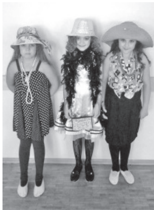
Meie noored näitlejad.