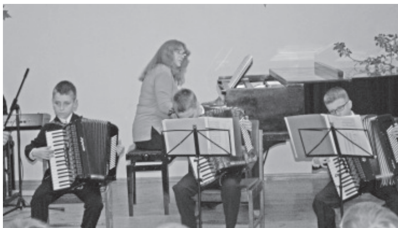
Laval on noored akordionistid.