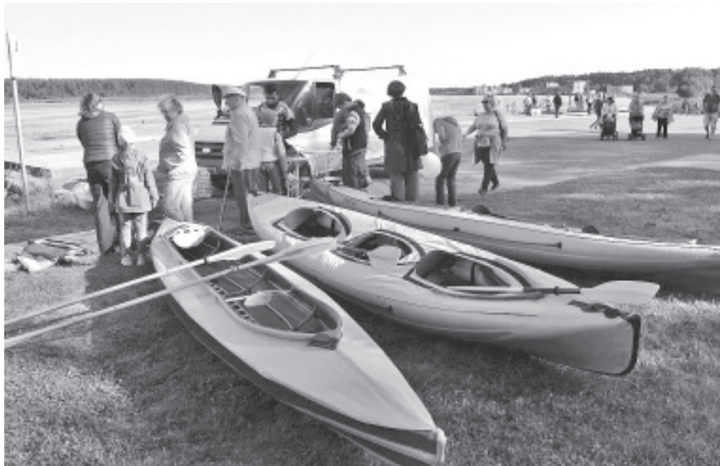
Kohe minnakse merele.