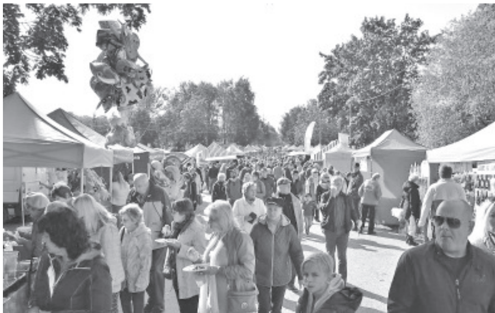
Silmulaat on alati rahvarohke.