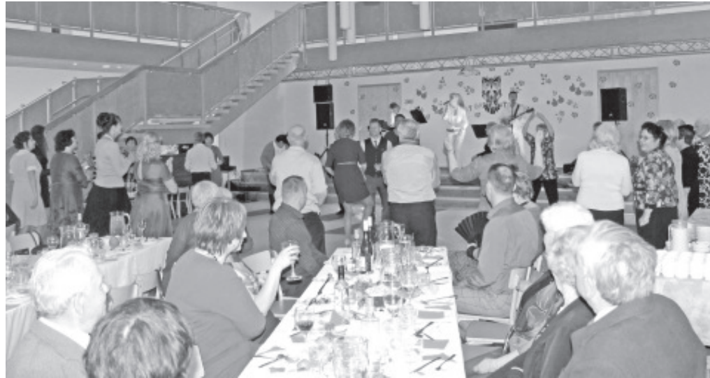
Lõikuspeol ei olnud aega igavust tunda.

haaras tantsuhoogu kaasa ka osa publikust. Suurepäraseks kingituseks sai kõikide jaoks Siiri Känd & Combo Band'i esinemine – eesti tantsumuusika, 1980.–1990. aastate diskohitid ja vene hitid kõlasid kogu õhtu