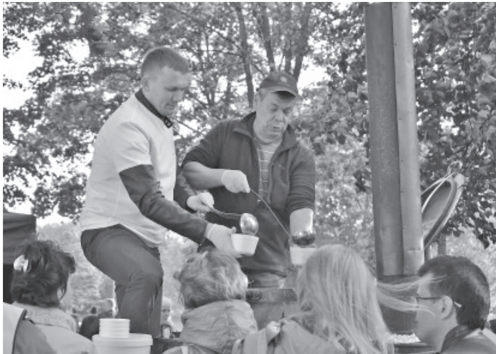
Kalasuppi jagub kõigile soovijatele.