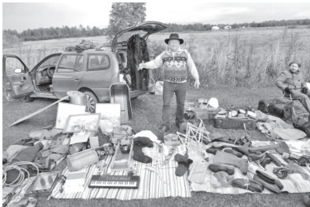
Ühe mehe vana võib olla teise mehe uus.