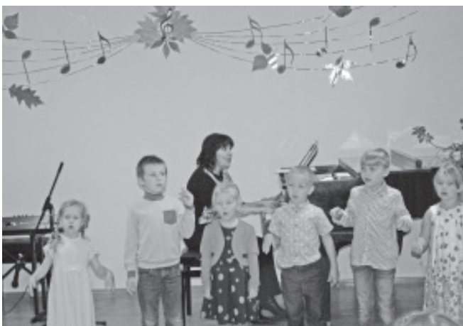
Esinemisjärg on Vaivara lasteaia mudilaste käes.