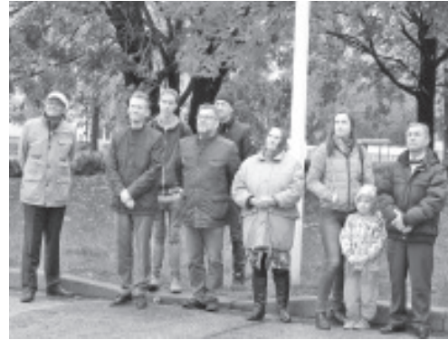
...ja tänulik publik.

Kolmapäeval, 11. oktoobril toimunud Vaivara Vallavolikogu viimasel istungil otsustati