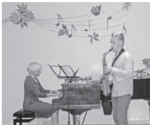
Puhkpill on üks nõudlikumaid instrumente.