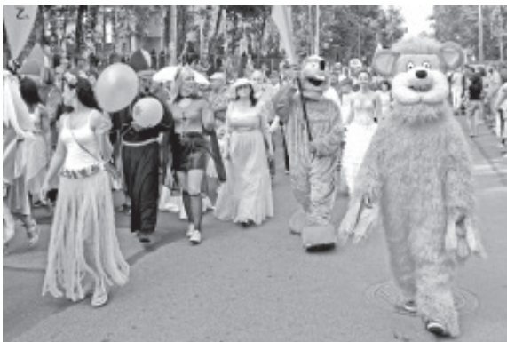
Rongkäigus oli nii karvaseid kui sulelisi.