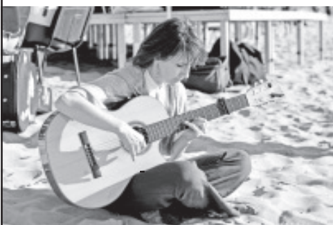
Rannaliival kõlasid laulud eriti kaunit.

Suvi on festivalide aeg ja Narva-Jõesuus toimuvad need praktiliselt kogu aeg. Mürarikas East Beach Fest sai just läbi, kui linnas hakkasid liikuma laulikud ja parkidest hakkas kostuma kitarrihelised. Moskva, Peterburgi, Klaipeda, Helsingi ja Narva laululoojad esitasid kolme päeva jooksul, kui tsiteerida Okudžav, mõtleivate inimeste mõttega laule.