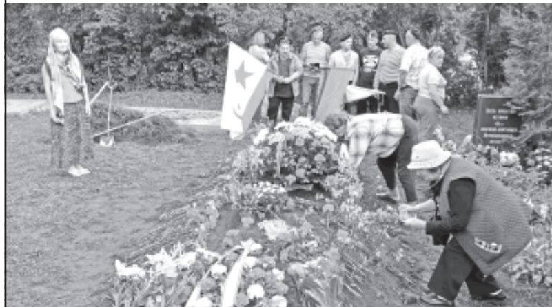
Puhake rahu!