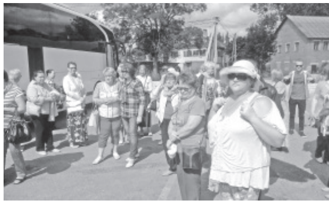
Vaadata ja kuulata oli palju.

Õhtul, jalutades mööda Pihkva vanalinna, jäi paratamatult silma linnas valitsev puhtus, lopsakas rohelus, palju lilli ning toredaid inimesi, kes nautisid peale tööpäeva lõppu igat vaba hetke. Raske uskuda, et Euroopa Liidu ja USA