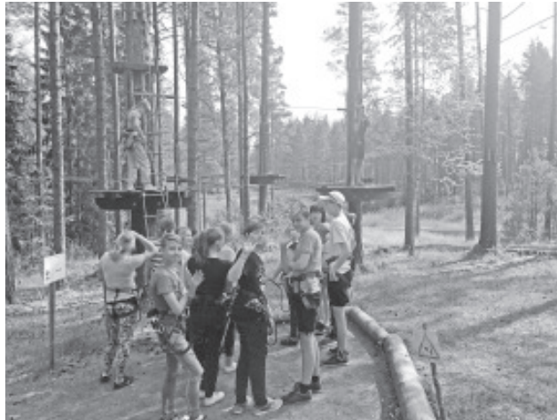
Noored Pannjärve seikluspargis.

Artjom : "Õõrahu oleks võinud hiljem olla. Noortekohtumine oleks võinud pikem olla. Juustu oleks võinud šnitli sees rohkem olla. (Osad noored tellisid Tallinnas lõunaks juustušnitli, aga nende suureks peetumuseks ei olnud seal liha, vaid ainult juust-toim.)"