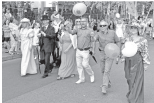
Ka Vaivara valla rahvas oli kostümeeritud.

ansambel Russkij Razmer, jõudis halb ilm ka meile kohale.