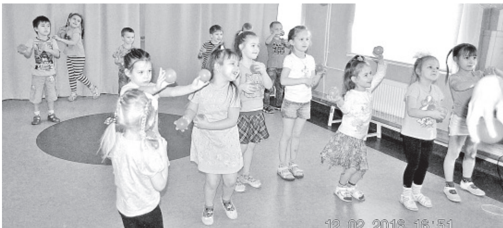
День друга в прошлом году в детском саду в Ольгина.