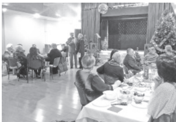
На совместной встрече в Ольгина.

Договорились, как в известном фильме – «дружить семьями» и, как можно чаще посещать мероприятия друг- друга. Искренняя благодарность мерию города Нарва-Йыэсуу, и руководству Центра культуры Вайвара за поддержку такого важного для людей и доброго мероприятия.