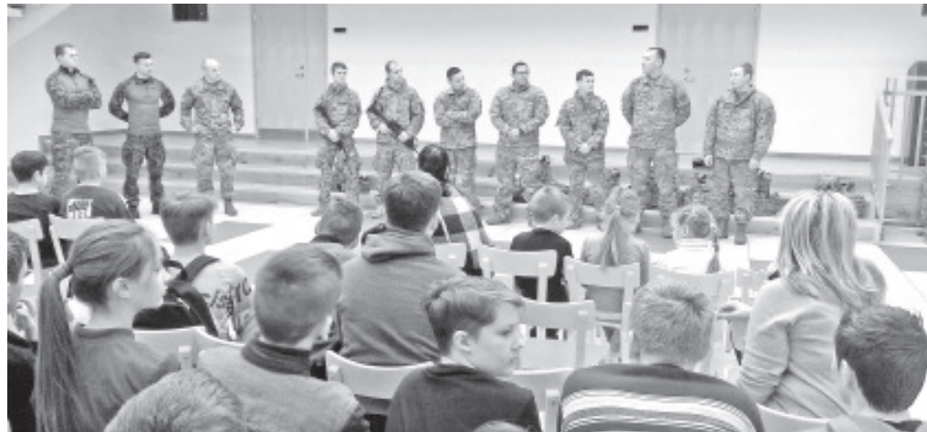
Солдаты на встрече со школьниками.