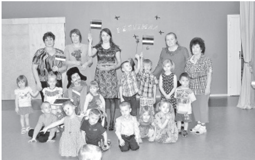
На праздновании дня рождения Родины в детском саду в Синимяэ в 2016 году.

В детском саду мы вместе учимся всему, что нас окружает: находить друзей, любить страну, в которой живем, познавать все, что нас окружает, а также знакомимся с обычаями и традициями. Вместе гуляем по улицам, смотрим, какие учреждения находятся рядом с нами и кто где живет. Одним словом, изучаем окрестности. Группы в нашем детском саду объединенные и каждый момент есть чему учиться и узнать что-то новое. Детский сад, как второй