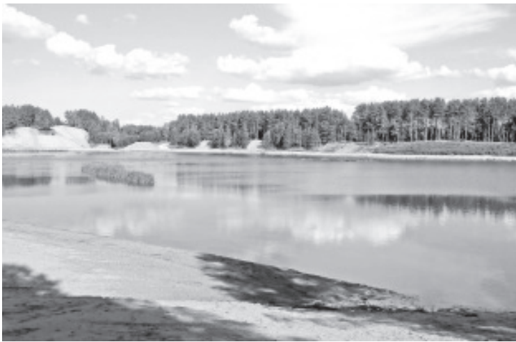
Песчаный карьер в Рийгикюла превратился в великолепное место отдыха.

Кирикукюла расположен на расстоянии 2-ух километров от поселка Синимяэ, и начиная с 1966 года, с того времени, когда там впервые стали добывать песок, место это все знали, как песчаный карьер в Соокюла. В какой-то момент работы там прекратились. Остались неиспользованные запасы песка и заброшенная территория песчаного карьера, это означает, что там, в настоящий момент заброшенные водоемы, склоны и отвалы. По утвержденным министром окружающей среды данным запасы песка месторождения Кирикукюла