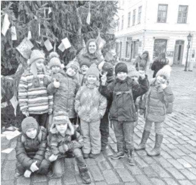
Sinimäe kooli õpilased Tartus raekoja platsil.

Raekoja platsil ootas meid kaunis kuusepuu. Koolis valmistatud soovidega südamekesed Jõuluvanale riputasid lapsed kuuse okstele. Kasutasime vaba aega jalutamiseks kuuseplatsil, kus lapsed said kiikuda, sõita jalgrattatreneràžööril, pildistada