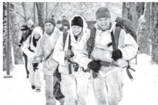
Sel aastal jäid suusad koju.

Rätsepa sõnul sai kogu luurevõistlus nii välismeedialt kui ka välisvõistkondadelt positiivset tagasisidet. Rajal olid sellel aastal Soome, Poola ja Saksamaa võistkonnad. Välisosalejaid võiks rohkemgi olla, kuid nii tõsine sõjaretk talvises Eestis käib paljudele lihtsalt üle jõu. Rahvusvaheliseks muutumine on olnud üks korraldajate peamisi eesmärke. Nüüd, kui see saavutatud ja järgmisel aastal käib paljudele lihtsalt üle jõu. Rahvusvaheliseks muutumine on olnud üks korraldajate peamisi eesmärke. Nüüd, kui see saavutatud ja järgmisel aastal käib paljudele lihtsalt üle jõu. Rahvusvaheliseks muutumine on olnud üks korraldajate peamisi eesmärke. Nüüd, kui see saavutatud ja järgmisel aastal käib paljudele lihtsalt üle jõu.