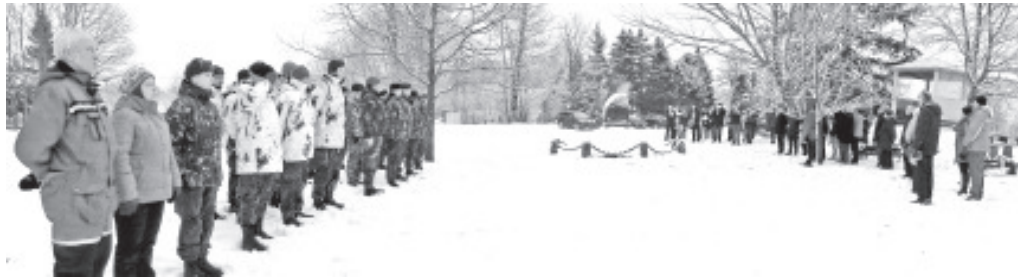
Utria dessandi raames toimival mälestustseremoonial on alati osalenud ka Soome võistkond.

Sellel aastal katsetas Utria dessandi ülesannete lahendamist ka samal ajal Narvas visiidil olnud president Kersti Kaljulaid, kes tegi kaasa poolekilomeetrise lõigu takistusrajast. President proovis kõie abil mäest ülesminekut ja võsast läbitungimist. „Minu oli kergem, sest