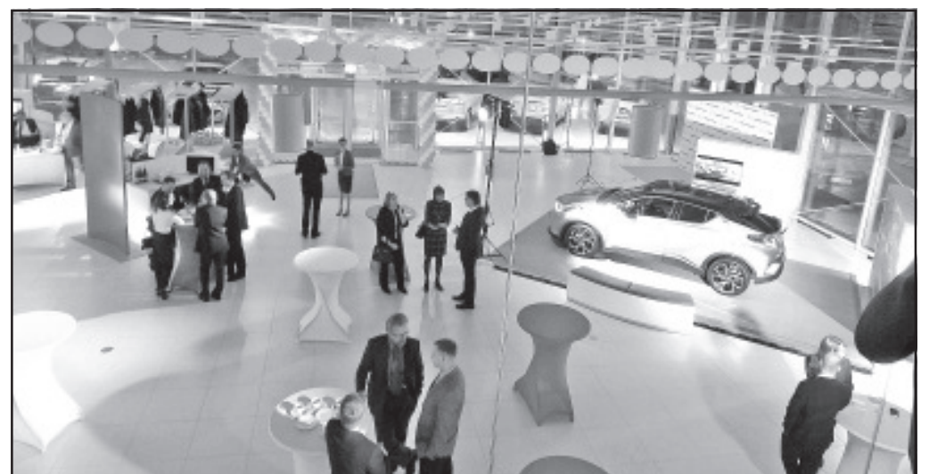
Reedel, 20. jaanuaril avati Olgina uus Toyota autokeskus, mis on nii tehnoloogia kui ka teenindusstandardi poolest üks Eesti moodsamaid autokeskusi. Autokeskus asub aadressil Vaivara vald Olgina alevik Rebase 9.