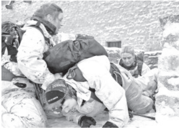
Ka seekord osalesid naisvõistkonnad.

„Liiga lihtne,“ iseloomustas 19. korda Utria