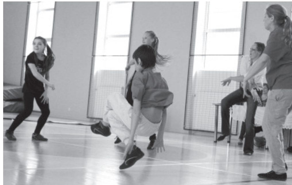
Каждый показывает, что он умеет