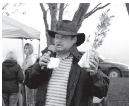
Пестрая ярмарка.

Было, как было – к одиннадцати часам утра народу было в достатке, как по одну, так