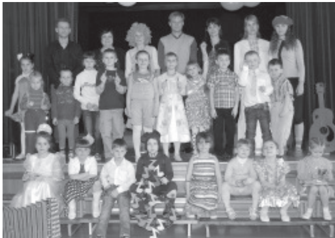
Нас так много!

На сцену пригласили первых выступающих. В зале стояла тишина, и все внимание было обращено только на конкурсантов. Но вдруг послышалась какая-то странная музыка, под аккомпанемент которой на сцену вышла Ложная Нота, которая своим кривляньем пыталась помешать выступлению детей. К счастью это ей не удалось. Песенная карусель закружилась в полную силу.