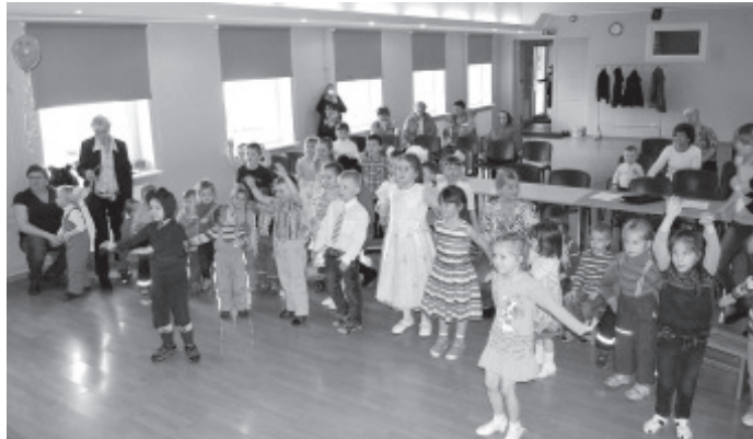
Певцы в азарте игры.