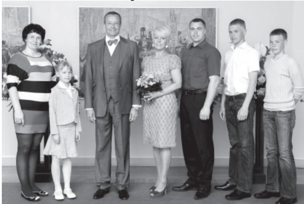
Есть что вспоминать....

„От такого приглашения я потеряла дар речи – огромное спасибо за оказанную честь