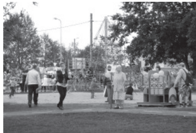
Самое верное испытать новые игрушки самим.

На построенной новенькой игровой площадке дети могут вообразить себе, что песочница – это на самом деле карьер, а игровой городок – завод масел или электростанция. Аттракционы игровой площадки имеют названия, характерные для местных предприятий сланцевой промышленности. Свое место на площадке нашлось как для карьера, шахтерского автобуса, завода масел, так и для электростанции. Чтобы поддержать полет детской фантазии, концерн Eesti Energia в сотрудничестве с волостью установил на площадке также и информационные таблички с пояснениями в доступной для детей форме.