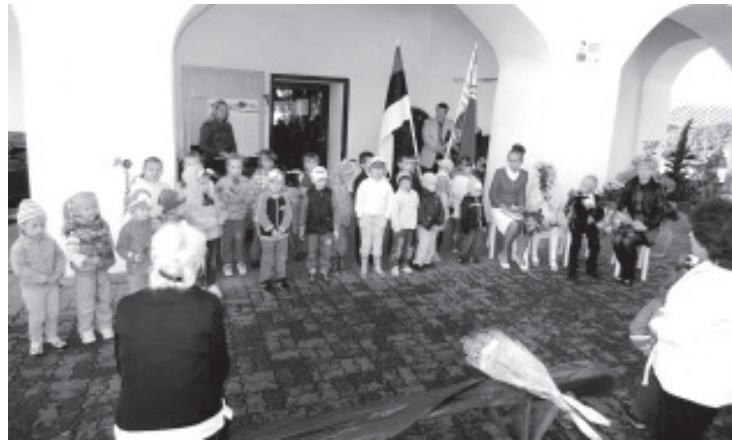
И детсадовская детвора пришла поздравить поступающих в школу.

подарили очень красивые цветы. И блеск в детских глазах был подтверждением того, как