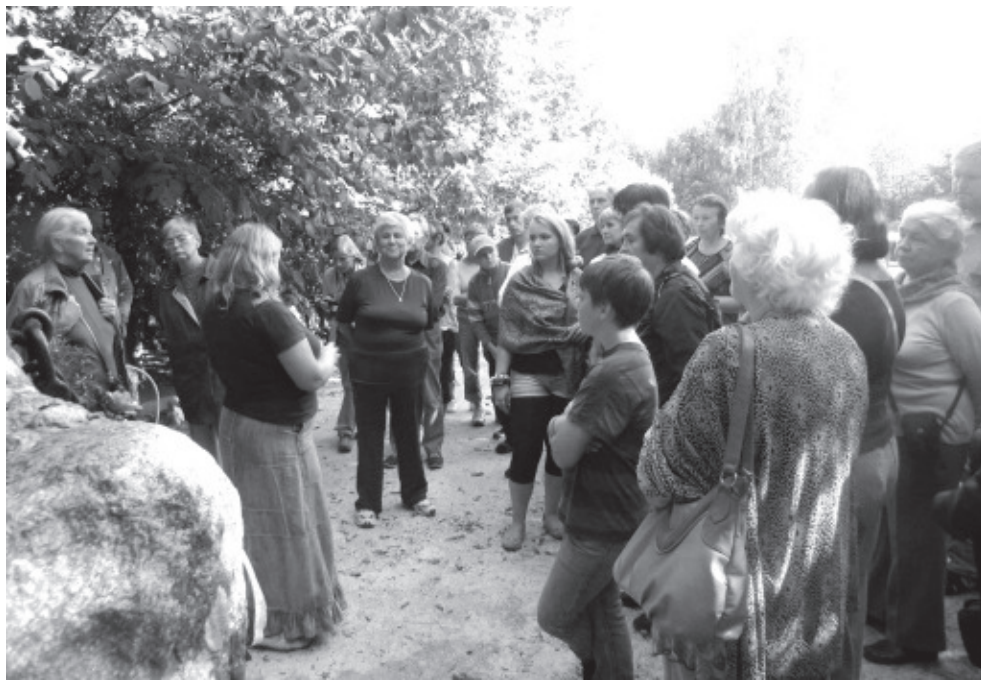
Участники похода в Нарва-Йыэсуу.

После чего оставили автобусы стоять на обочине, и прошли через бывший парк Кочнева пешком к месту высадки десанта Утриа. От этого известного в 19 столетии места летнего отдыха осталось не так уж и много, но все также по дну 20 метрового в глубину ущелья течет речушка Утриа и гордо