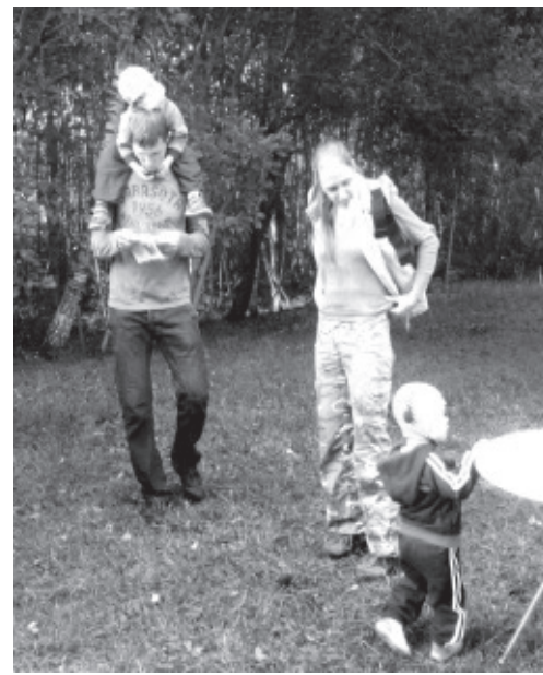
С тропы ориентирования пришли самые молодые

В частном доме отопительную систему можно почистить и самостоятельно, однако, по крайней мере, один раз в пять лет отопительные системы должны чистить лица, имеющие квалификацию трубочиста. Соответствующая норма закона начала действовать с 2010 года. Таким образом, к сентябрю 2015 года должен быть проведен хотя бы один осмотр отопительных систем и проведена их чистка квалифицированным трубочистом. Это требование относится также к дачам, малым строениям и садовым домикам.