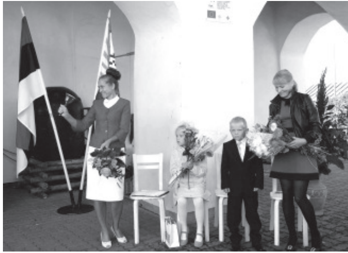
Кто больше волнуется, поступающие в школу или....?