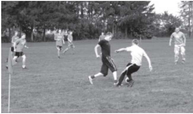
Интересные моменты в футбольных сражениях.