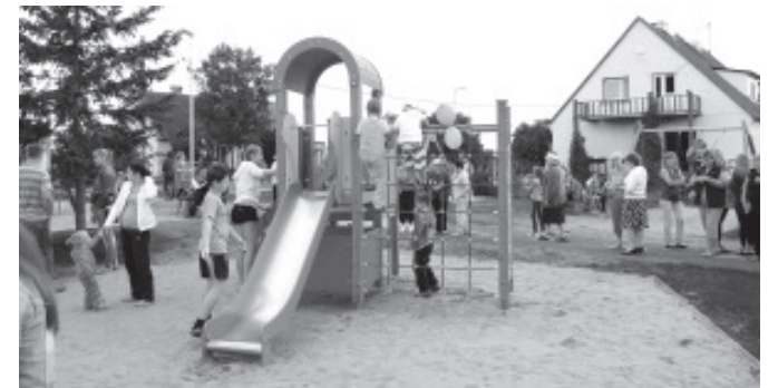
Новая игровая площадка интересна для всех возрастов.