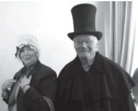
Большое оживление вызвала примерка одежды 18-19 столетий.

Нас встретили три «мызные барышни», две из них рассказали нам на русском и