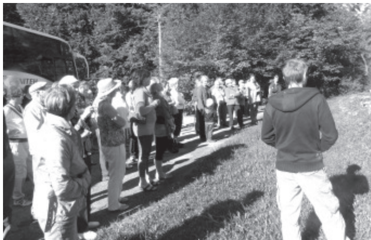
Ивику слушают с большим вниманием.