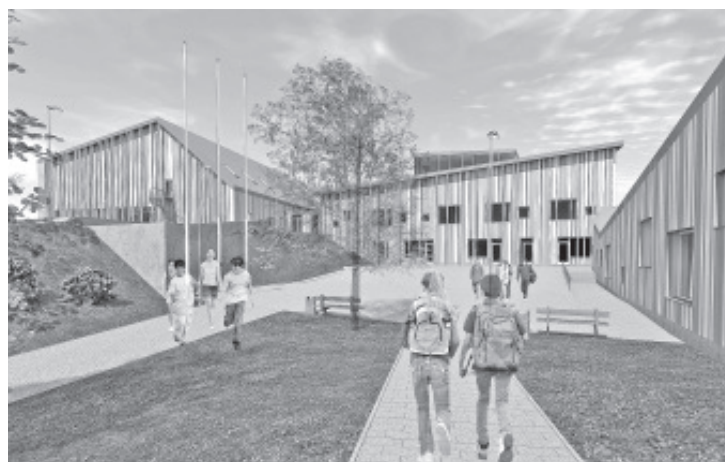
Так выглядит новая Синимяэская школа.

Срок подачи ценовых предложений со стороны строителей 20.12.2013 года, намеченный срок завершения строительных работ 31.07.2014 года. Предполагаемая стоимость строительных работ 2 700 000 евро, к этой сумме добавится еще налог с оборота. К выше названным суммам прибавятся также затраты на оснащение и приобретение инвентаря, а в отношении этих расходов необходимые госпоставки будут проведены в 2014 году.