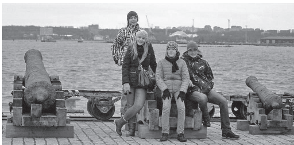
Школьники успели познакомиться и с тем, что стоит во дворе ангара «Lennusadam».

По этой черной трубе на потолке подлодки «Лембиту» матросы могли выбраться наружу в случае бедствия. В офицерском помещении такой возможности покинуть лодку не было, так как по неписаному закону для них было делом чести уйти на дно вместе с кораблем.