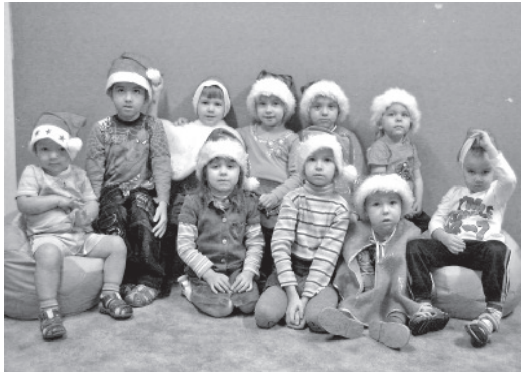
Маленькие гномики Вайвараского детского сада.