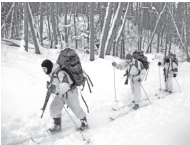
Десант Утрия проходил (пробирался) как по снегу, так и по грязи.

«Организовать зимние соревнования значительно труднее, чем летние», - сказал президент Общества Эрнэ. «Во всяком случае, я надеюсь, что 16 - 18 января будут интересными и богатыми на испытания, как для участников, так и для организаторов. Уже заранее благодарю Вайварскую волость и Кайтселитт за хорошее сотрудничество при организации этих соревнований!»