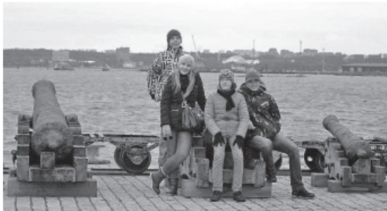
Koolinoored jõudsid tutvuda ka Lennusadama õuealaga.

Teiste eksponaatide seas on välja pandud allveelaev Lembitu, vesilennuk Short 184 ja üks Eesti vanimaid laevavrakke Maasilinna laev. Võimalik on vaadata purjekaid, jääpurjekaid, erinevaid ajaloolisi aluseid, suurt valikut meremiine ja muud meresõjatehnikat. Kõigi eksponaatide juures on selgitavad tekstid ja